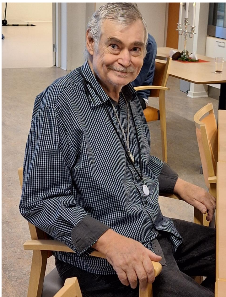
Musikken spillede, og vi inviterede til dansecafe med drinks, øl eller sodavand!