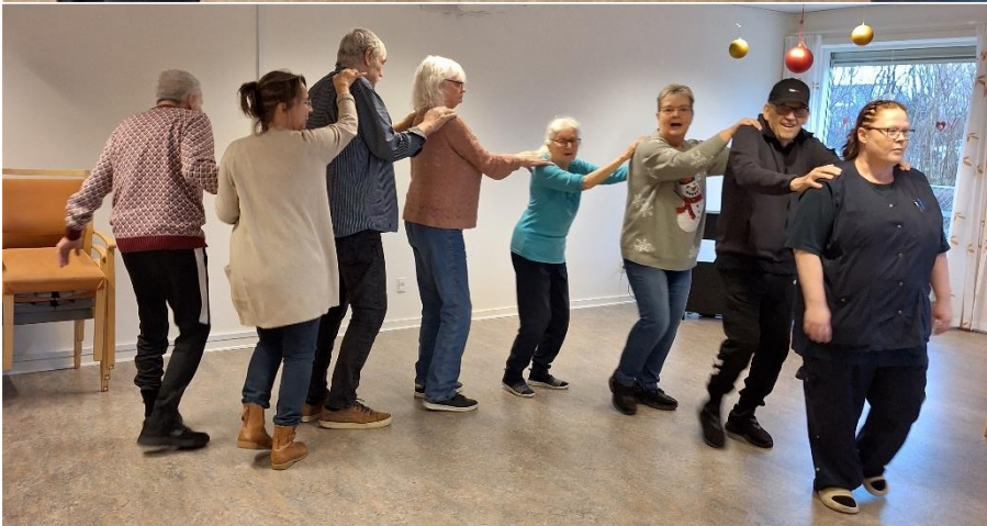
Den 21. december var der godt gang i dansegulvet!