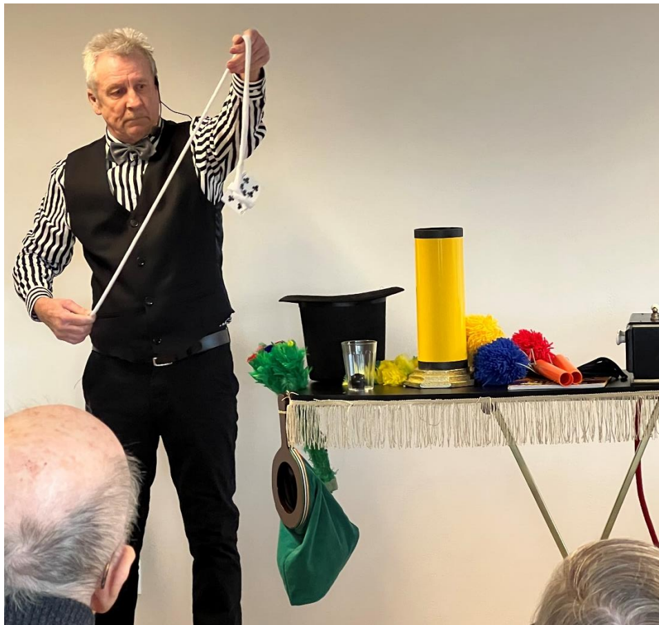
Og han har lovet at komme igen en anden god gang...;-)