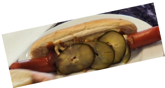
.....Serveret med det hele!