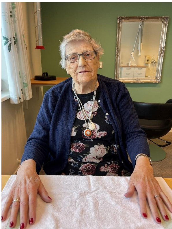
At få lagt neglelak i frisørsalonen....