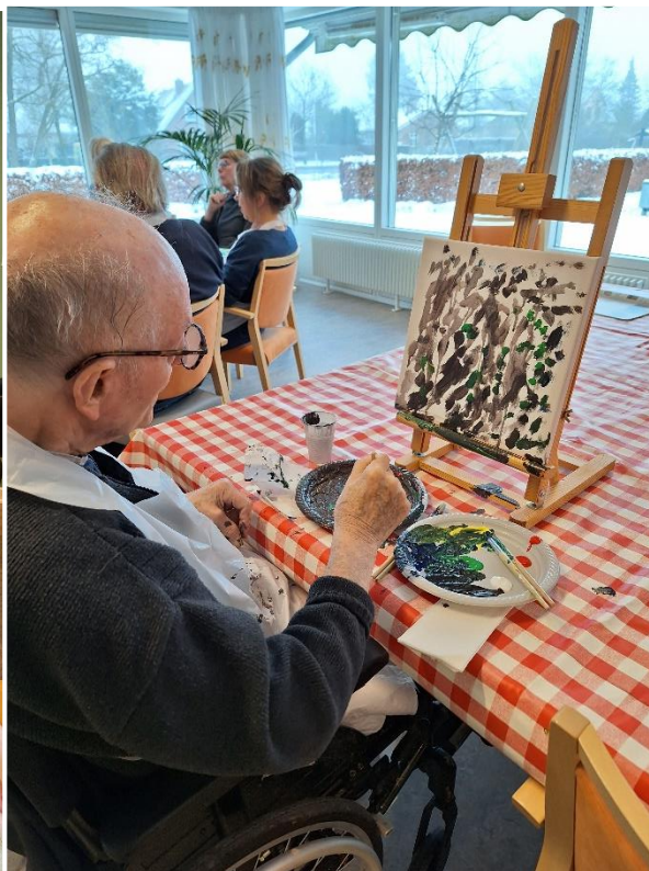
Og at male....