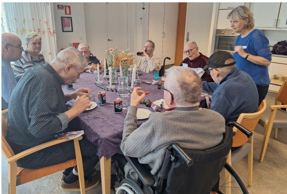
En såkaldt "herredag" i januar bød på hotdogs og "James Bond" film – og god stemning