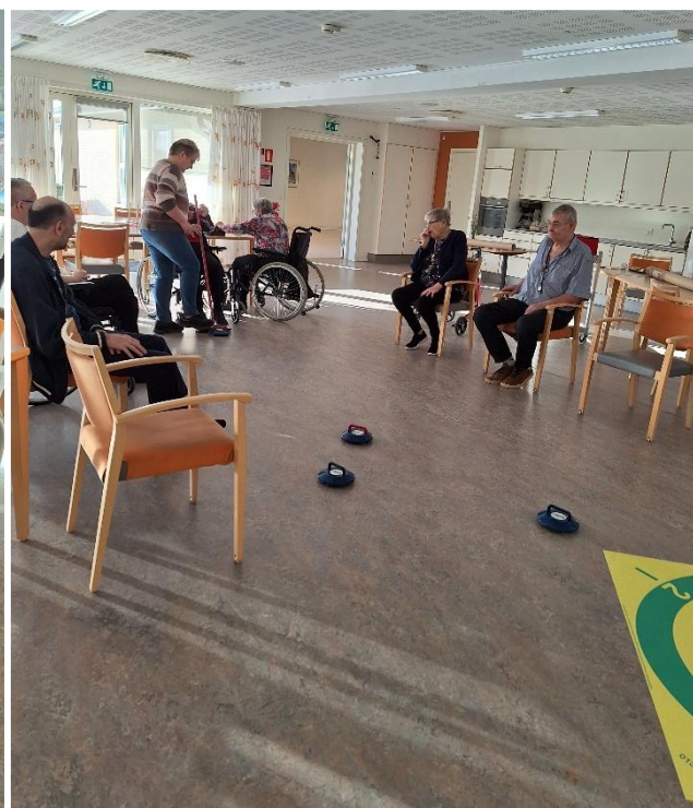
Der blev spillet "curling" i stor stil .... og med imponerende indsatser :-)