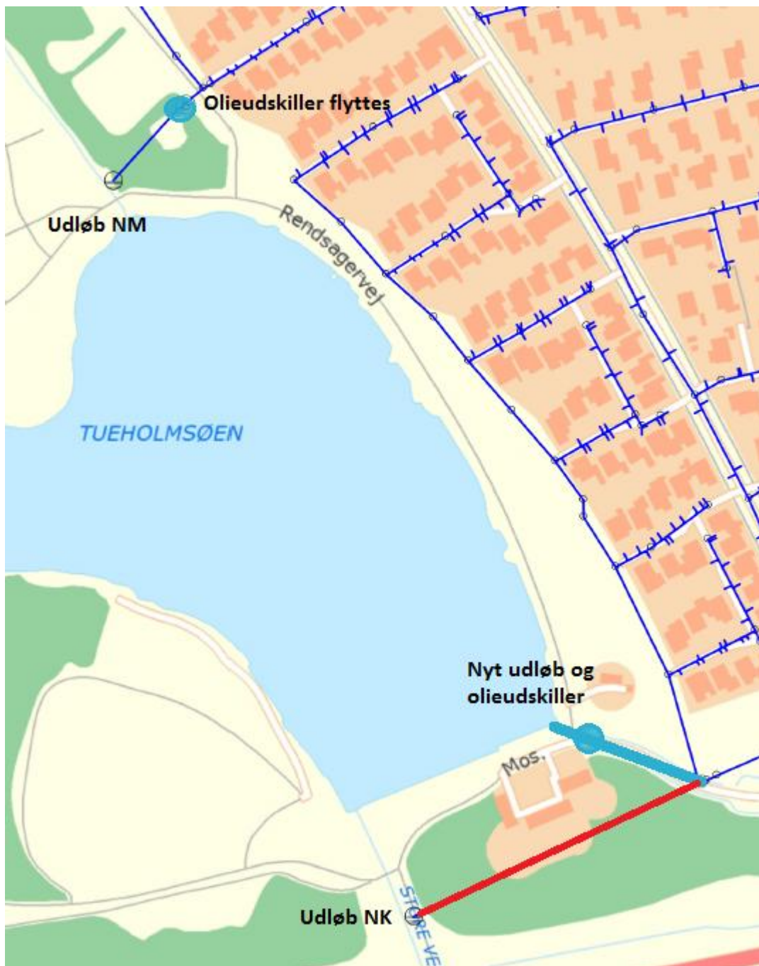
Bilag 2: Omfang af projektet vedrørende flytning af olieudskillere og udløb ved Tueholmsøen.

De to olieudskillere og det nye udløb til Tueholmsøen er vist med lyseblå. Det eksisterende udløb NK samt tilløbsledning, som nedlægges, er vist med rød.