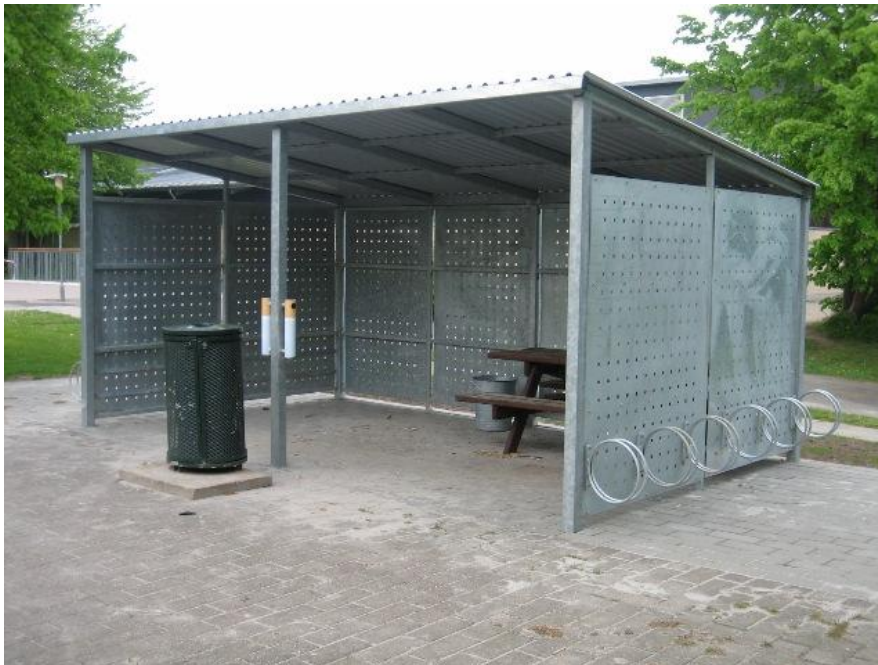
Skur ved Gildbroskolen (skuret ved Vejlebrovej vil være et aflukket skur )