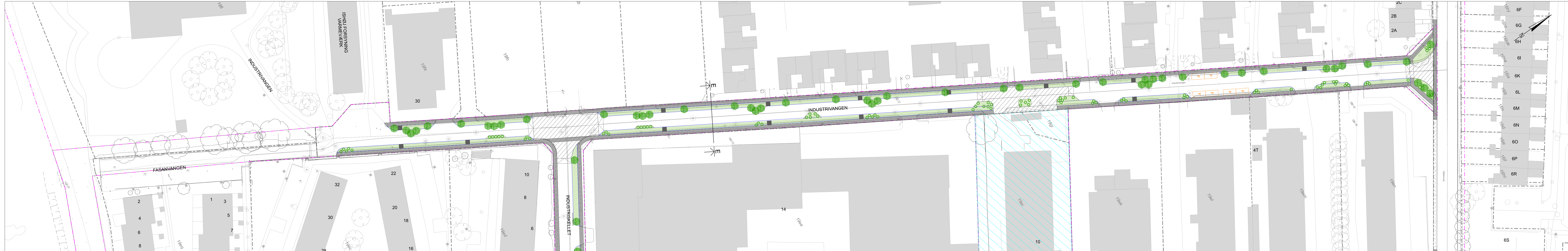
Industrivangen Scenarie 3 - Fokus på fortove 1:500