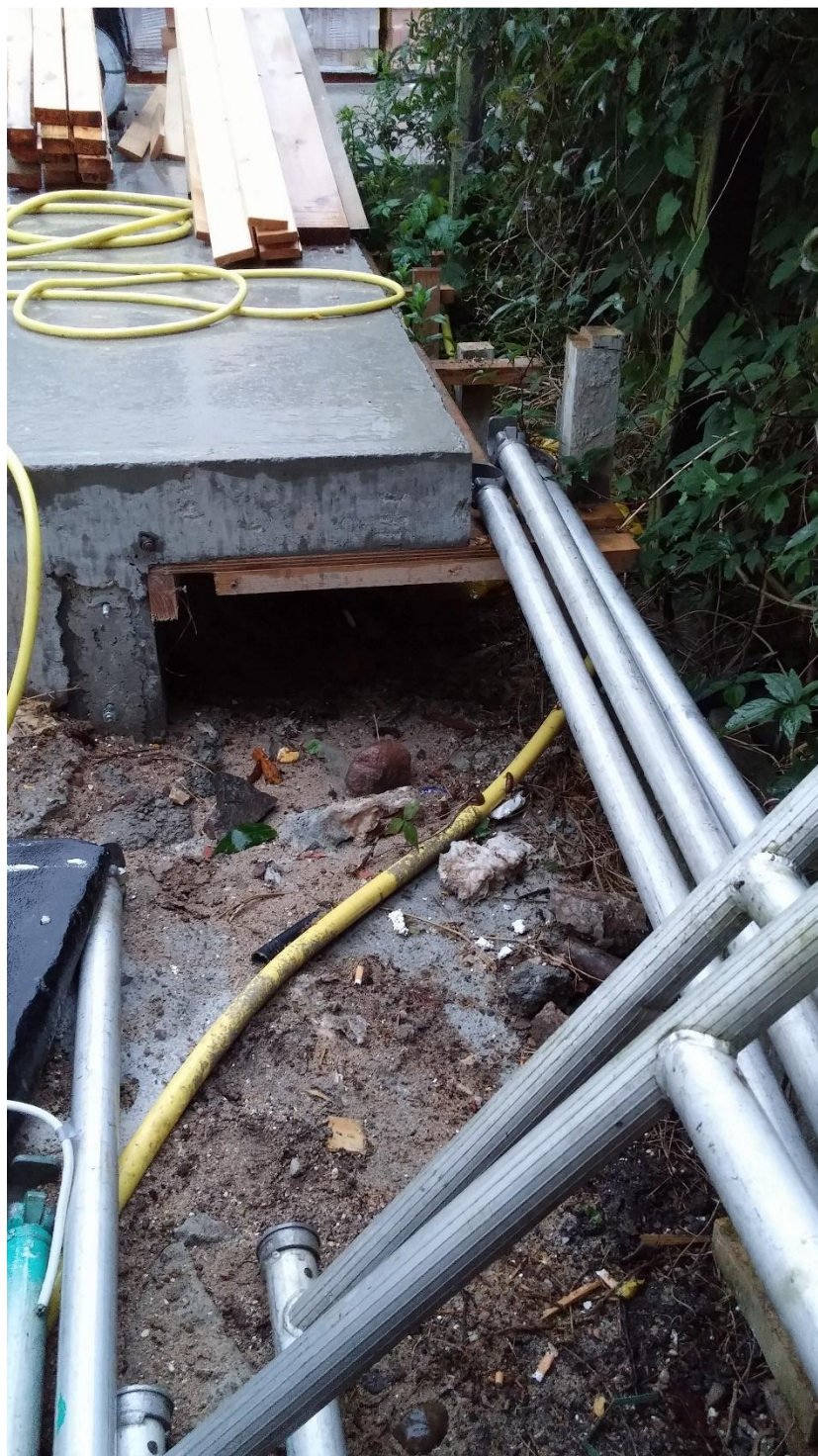
Billede 1 Her ses hvordan terrassen efterfølgende er forøget ud over det støbte fundament