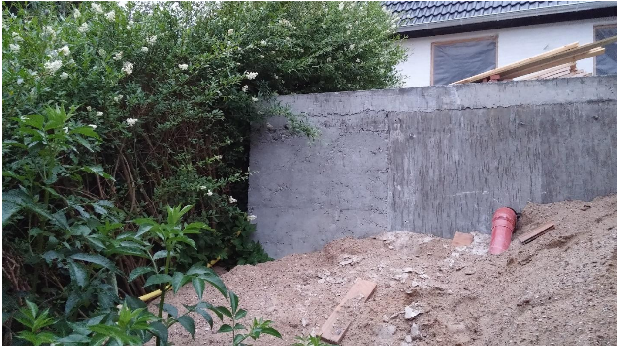
Billede 2 Her ses terrænregulering mod skel der er minimum en meter.