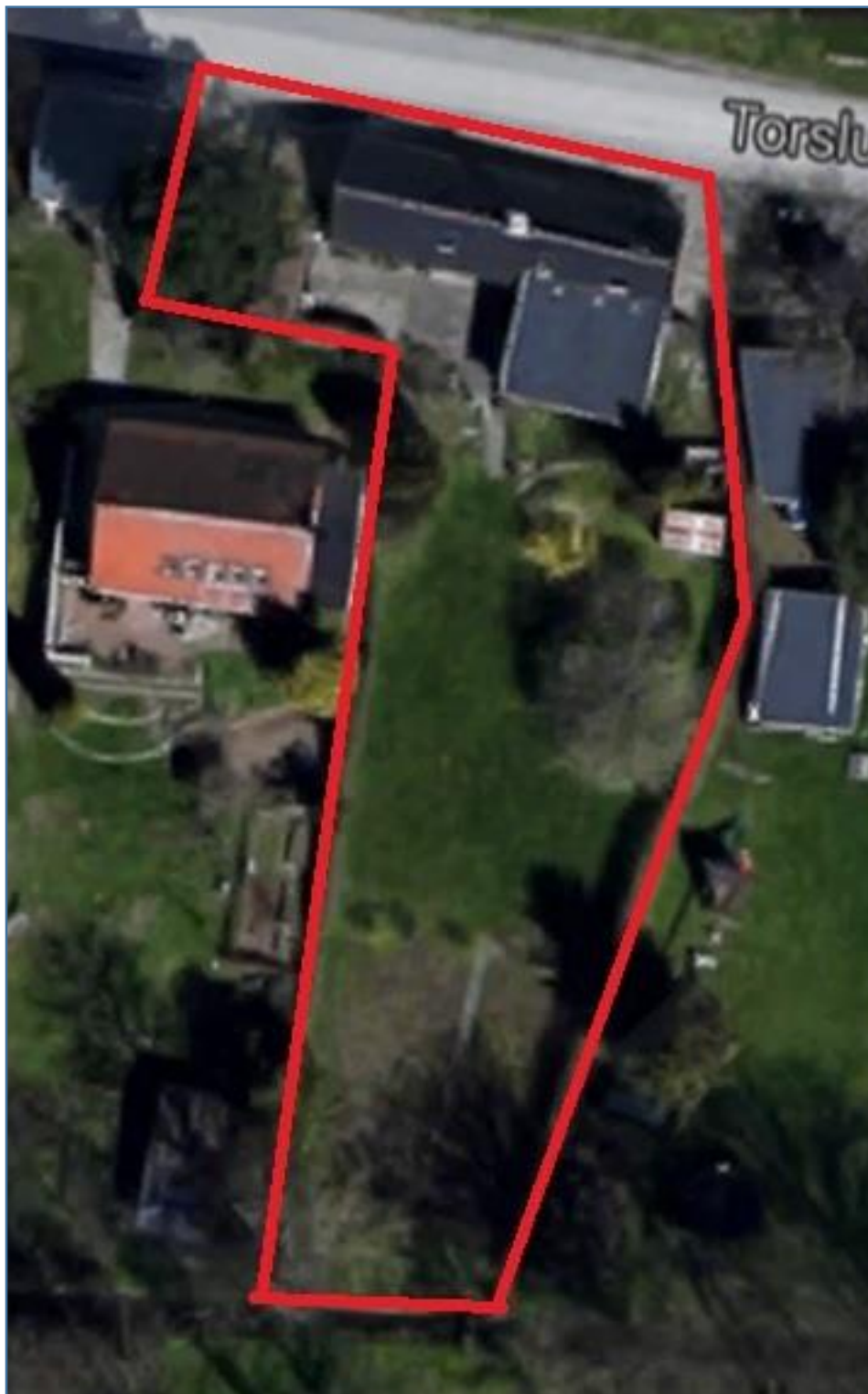
Billede 4 Her ses omfanget af det tidligere terrasseareal.