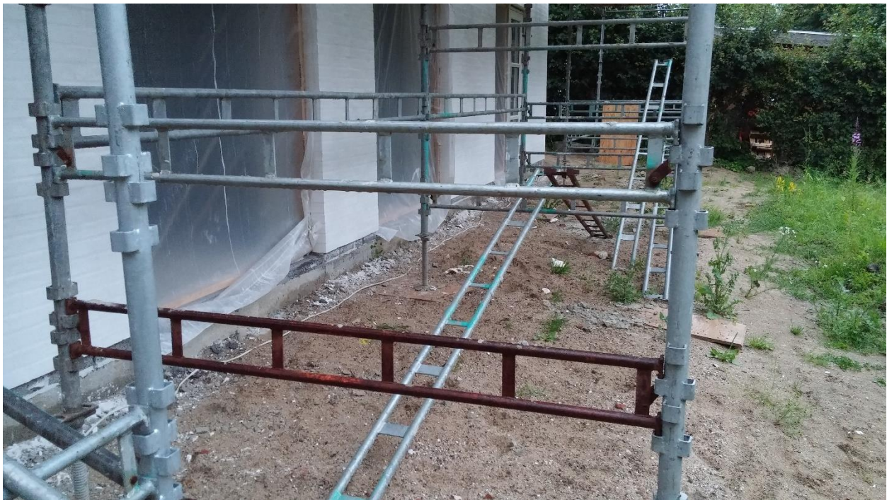
Billede 3 Foran huset er der IKKE plads til det overskydende muldlag fra resten af haven