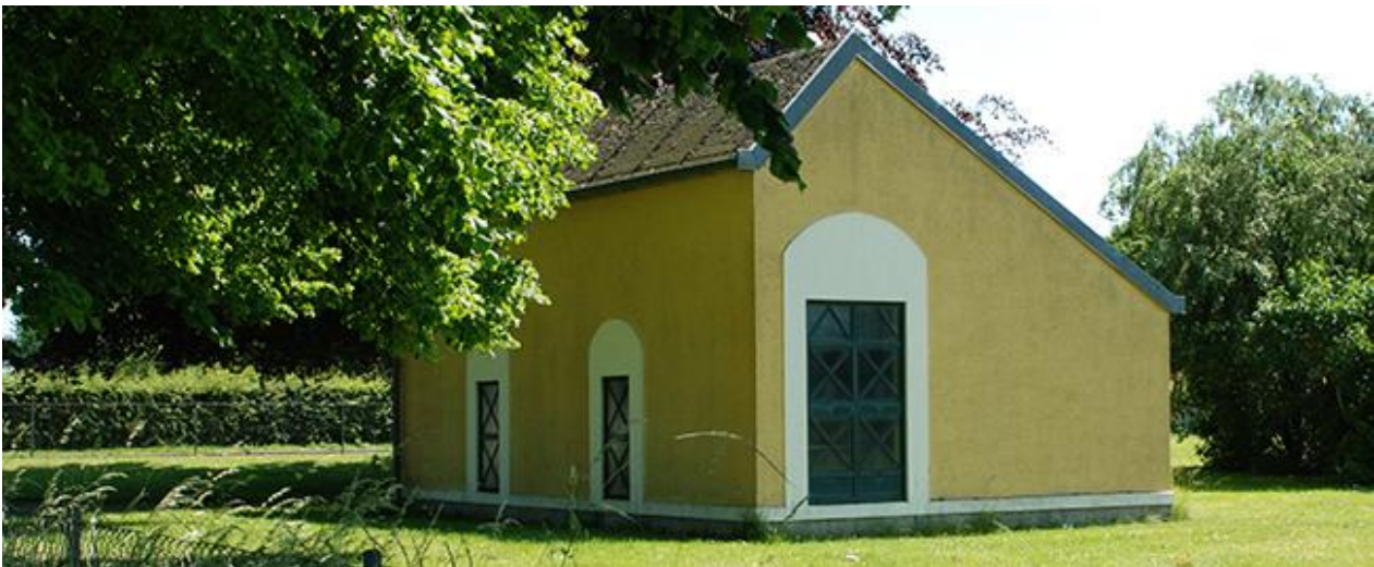
Eksisterende pumpestation ved Allévej.

Vest for den nuværende indkørsel til vandværket ligger en pumpestation. Bygningen fremstår i gulmalet puds med enkle murede detaljer og tag i tagpap.