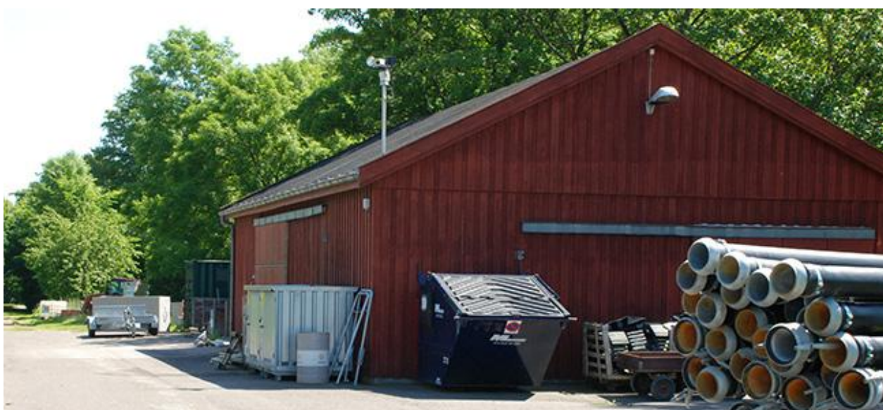
Den eksisterende lade med oplag foran.

I den sydøstlige del af lokalplanområdet findes i dag en ladebygning opført i træ, som bruges til forskelligt oplag og maskinel.