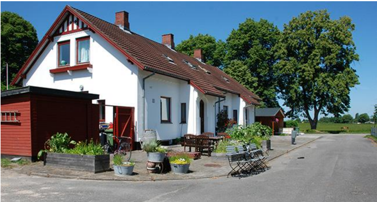
En af de oprindelige funktionærboliger vest for vandværket.

som de fredede bygninger. På grund af ombygninger og ændringer er boligerne ikke fredet.