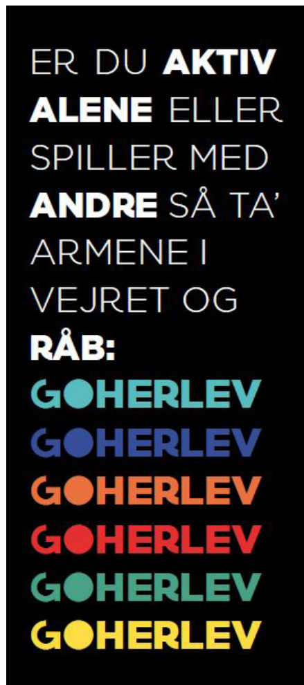
Vej-pylon for GOHerlev

Borgerne har ønsket sig og efterlyst nemmere veje (til information om) til idrætten, men uden at specificere formen.