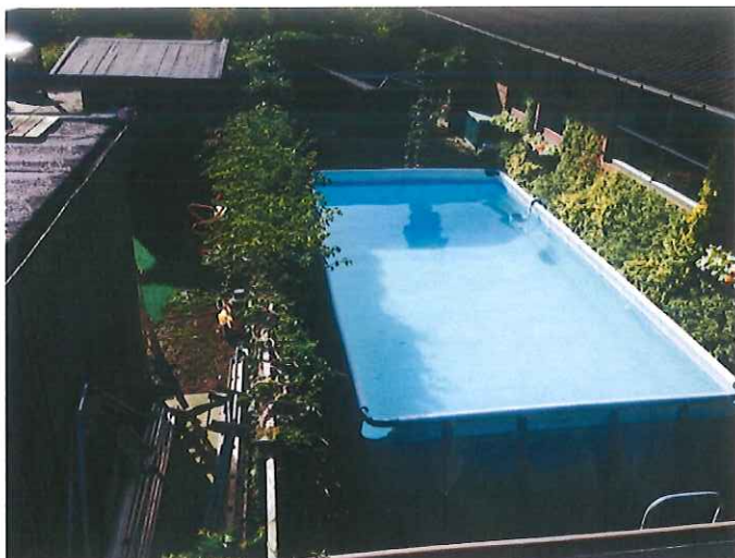
↑ Skel til nabo