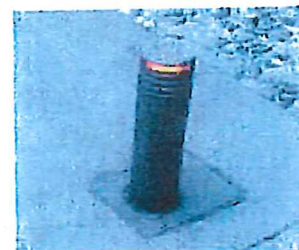
Pullert med lys