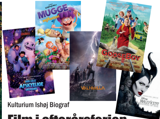
Kulturium Ishøj Biograf