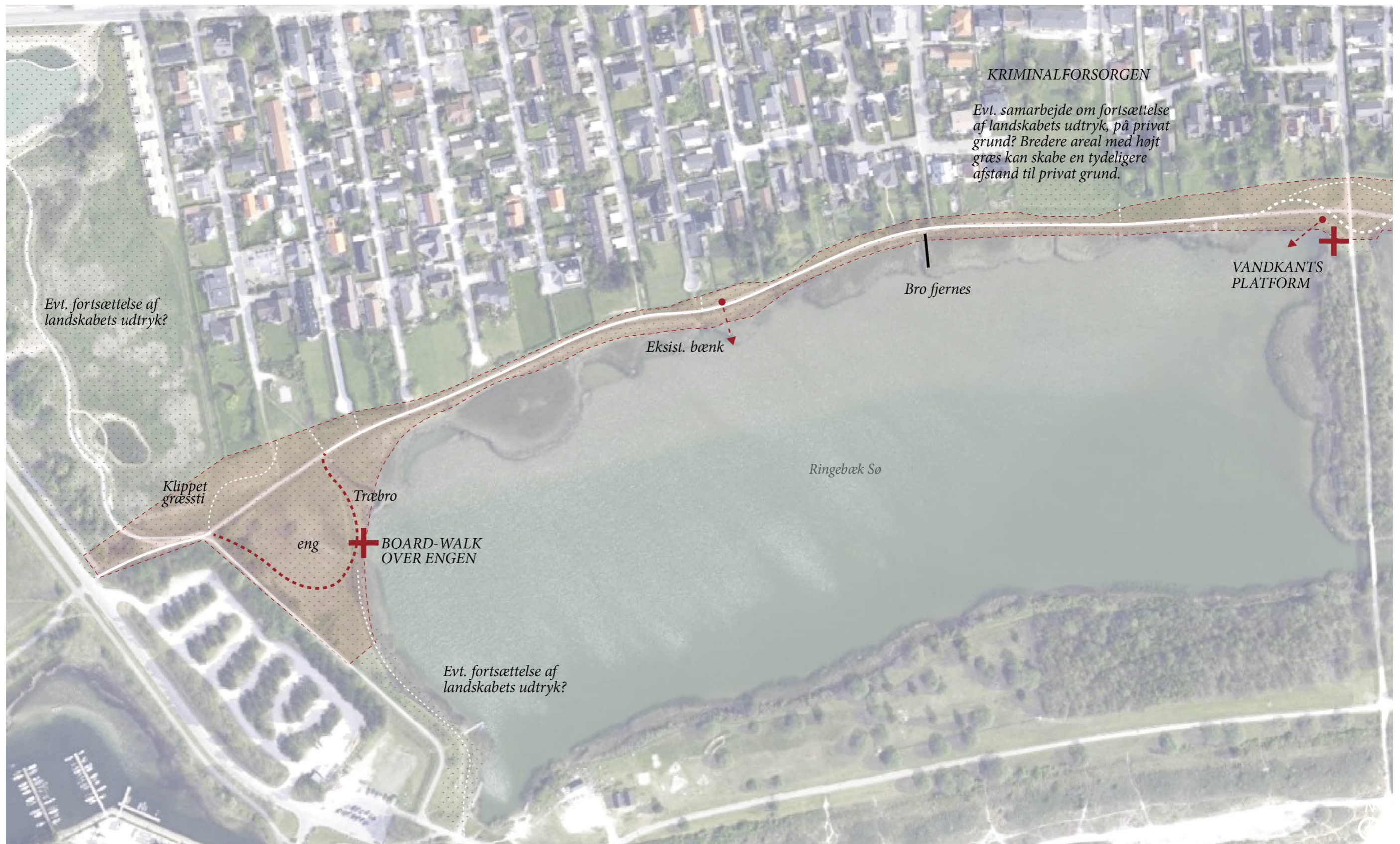
Planudsnit, forslag 1:2500