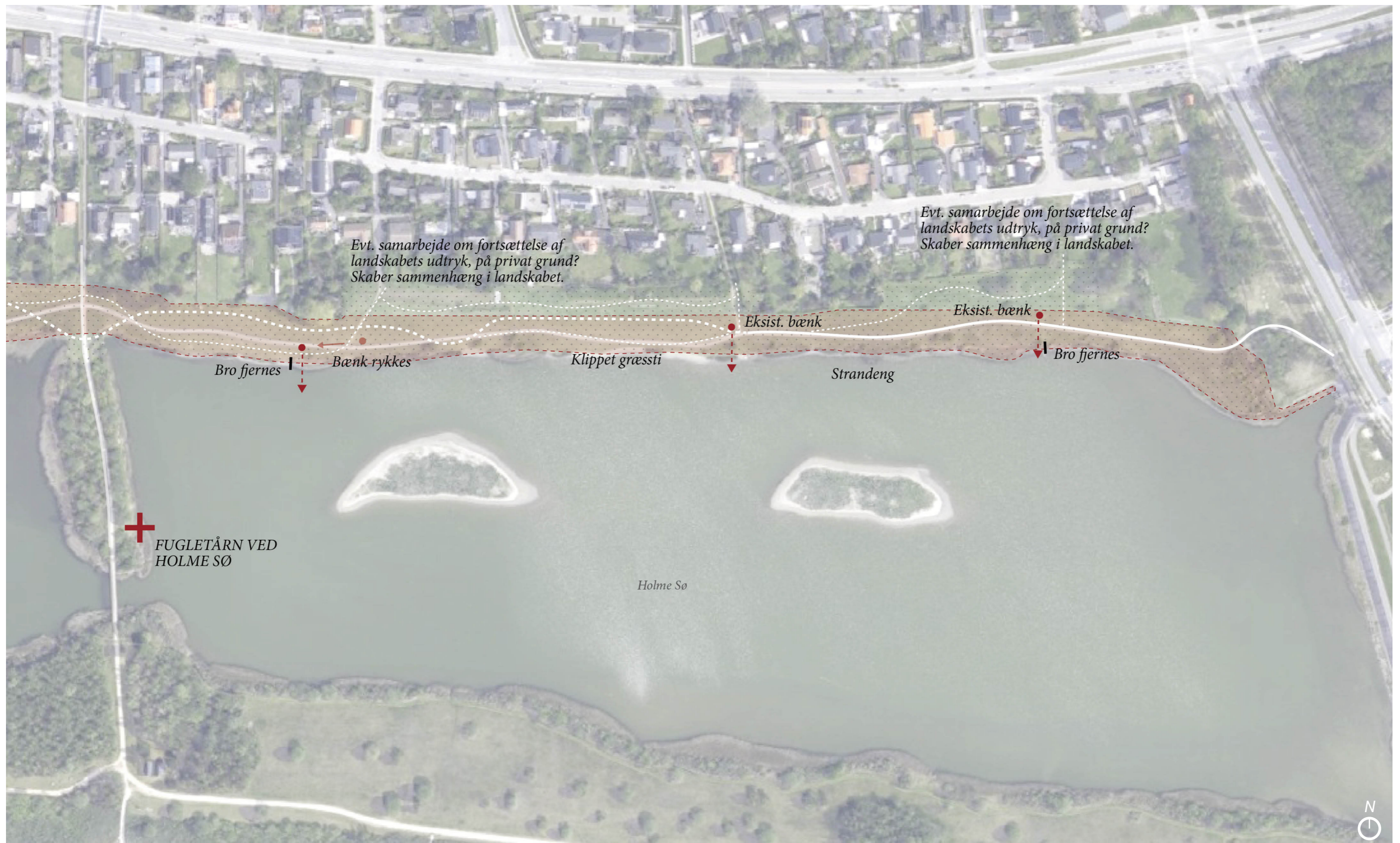
Planudsnit, forslag 1:2500