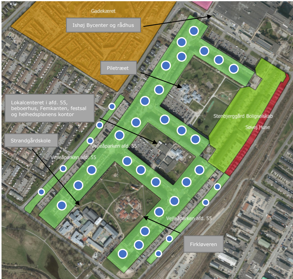
Kort over Vejleåparken (de grønne afdelinger og den røde). Den store grønne afdeling med de blå pletter er afd. 55, som er omfattet af den kommende helhedsplan.

Dertil kommer, at boligafdelingen falder ind under to af regeringens fem ghettokriterier. De to kriterier er andelen af beboere fra ikke vestlige lande og grundskolen som højeste uddannelsesniveau. 5