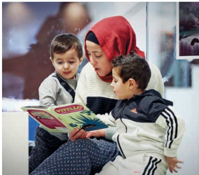
KULTURIUM ISHØJ BIBLIOTEK

Ishøj Store Torv 1, 2635 Ishøj www.kulturium.dk www.facebook.com/isbib Tlf.: 43 57 71 71