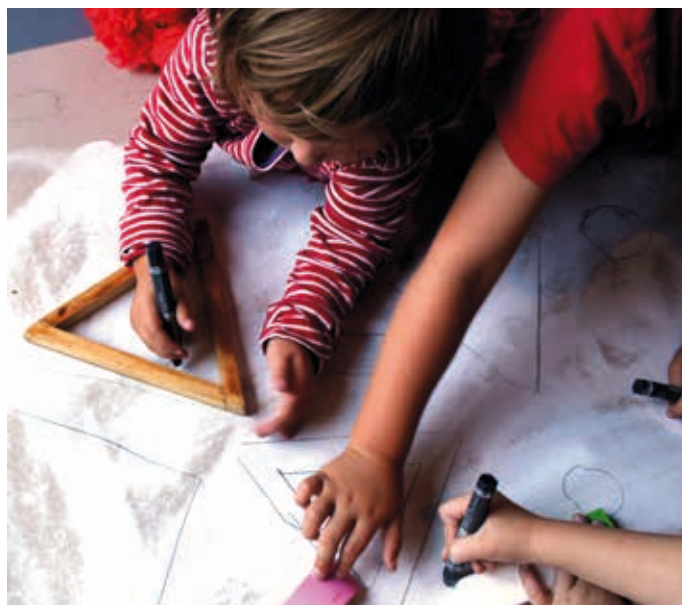
DANSK ARKITEKTUR CENTER

Vores grundforløb tager udgangspunkt i kunstneren Bjørn Nørgaards gigantiske gobelinkartoner – forarbejdet til gobelinerne i Riddersalen på Christiansborg Slot. Vi bruger kartonerne til at tage på historiske rejser rundt i kunstnerens billedfortælling, hvor vi eks. møder Thor og Odin, "sejler" med vikingeskib og handler med varer som vaskeægte vikinger. I november og december tilbyder vi forløbet "Jul på KØS", hvor børnene som detektiver skal finde spor efter jul i de forskellige tidsperioder, som gobelinerne viser.