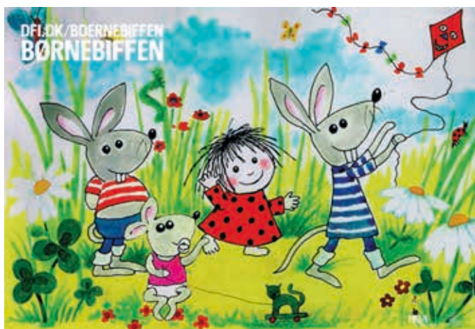
KULTURIUM ISHØJ MUSIKTEATER OG BIOGRAF

Ishøj Østergade 28, 2635 Ishøj www.kulturium.dk Tlf.: 61 93 64 30