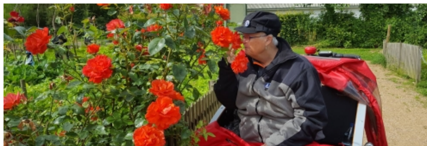
Cykling uden alder

Der er nu fem forskellige caféarrangementer i Ældres Netværk og derudover afholder vi 'Fællesspisning uden alder' på Torsbo hver 6. uge. Danmark spiser Sammen, som er et nationalt tiltag med fokus på at bekæmpe ensomhed og skabe fællesskaber på tværs var så stor en succes i april 2017, at den blev gentaget i uge 45, hvor 277 personer sammenlagt deltog i caféarrangementer og fællesspisninger.