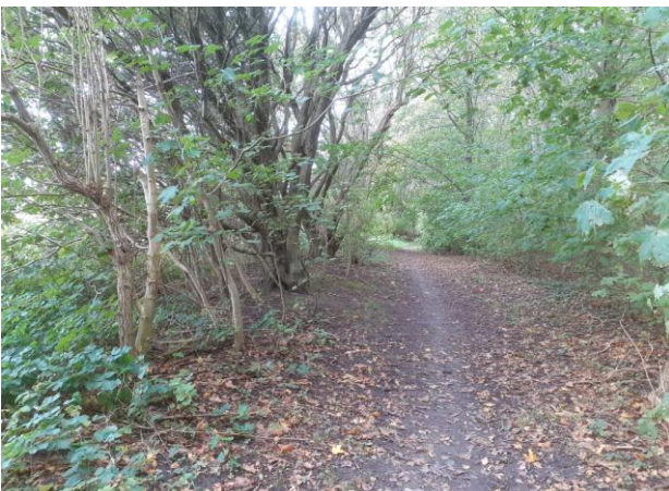
Stien i skoven langs diget set fra syd