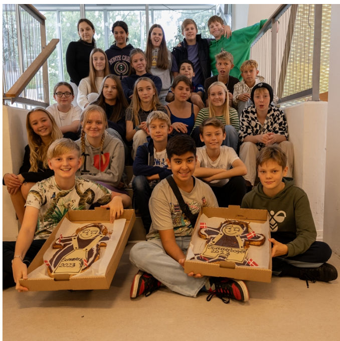
Vinderne af "Sommerbogen 2023" 6.A fra Ishøj Skole

For at kvalificere disse oplevelser og indhente mere viden om tiltaget og brugernes oplevelser, har vi i 2023 gennemført en evaluering via spørgeskemaer til både elever og lærere. 9 lærere og 133 børn har svaret. Nedefor er hovedkonklusionerne fra undersøgelsen.