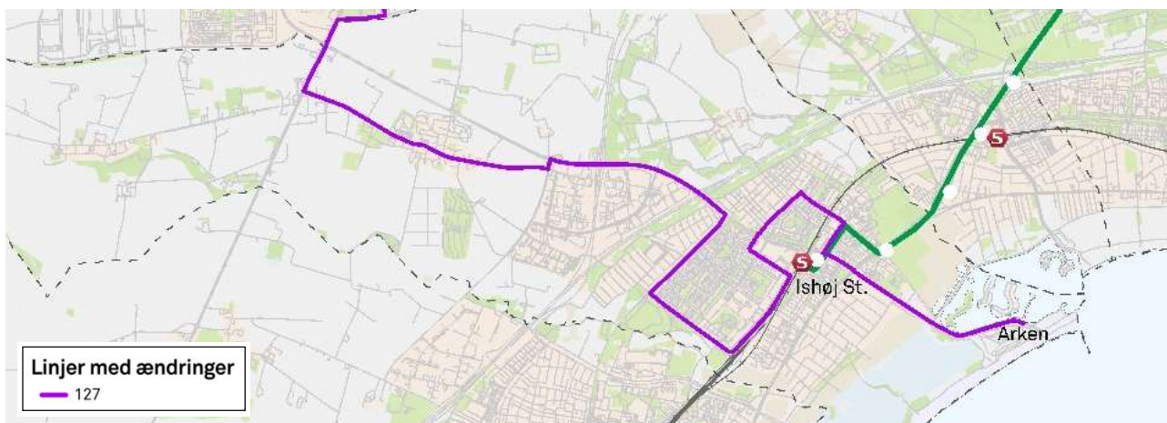
Figur 3 Forslag 1 med betjening af boligområdet