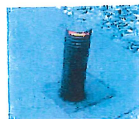
Pullert med lys