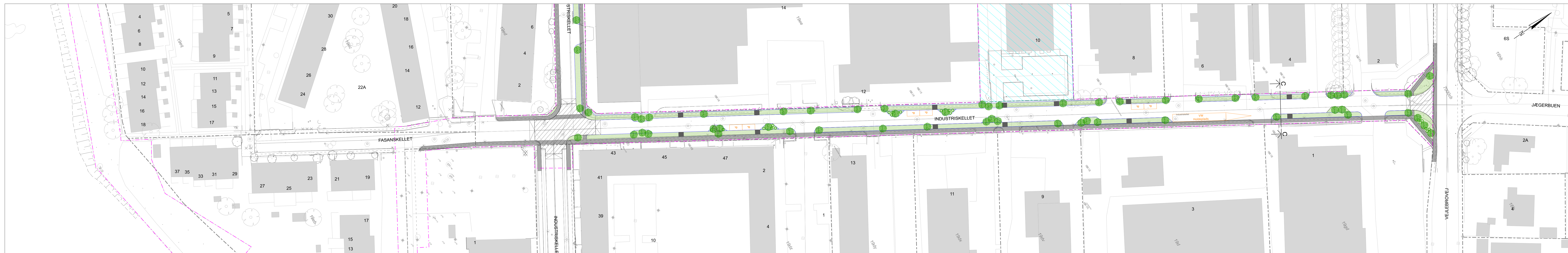
Industriskellet Scenarie 2 - Fokus på parkering i Industrivangen 1:500