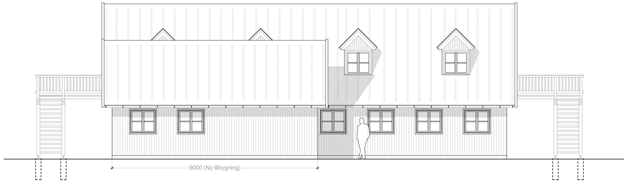
OPSTALT MOD NORD