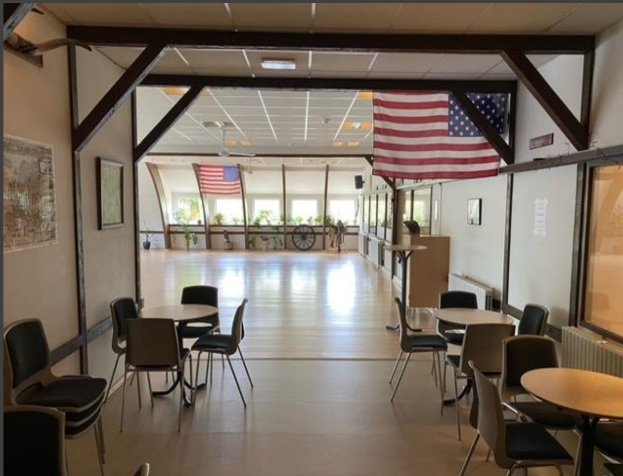
Lokale til linedance og øvrige aktiviteter