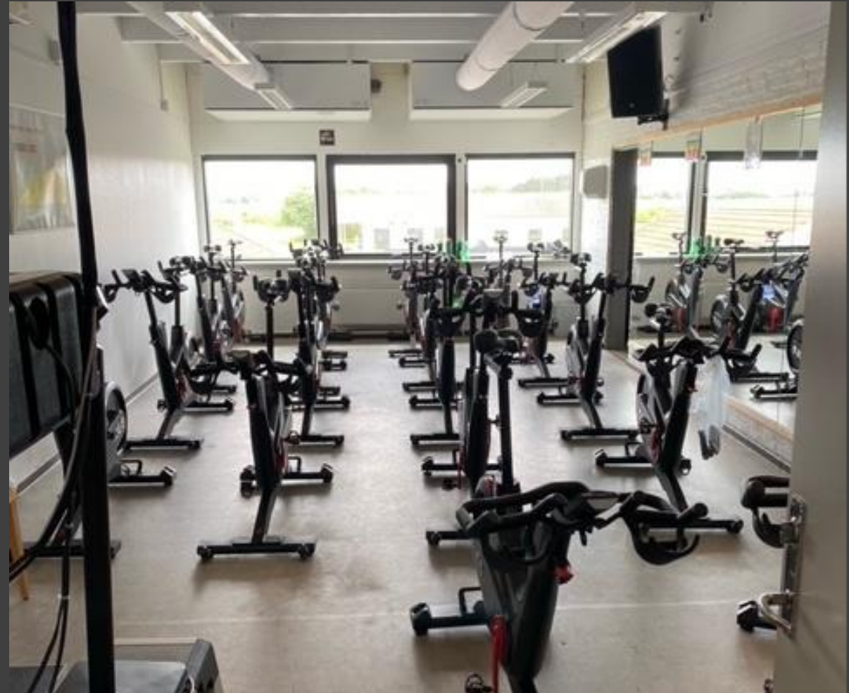
Lokaler til fitness og spinning