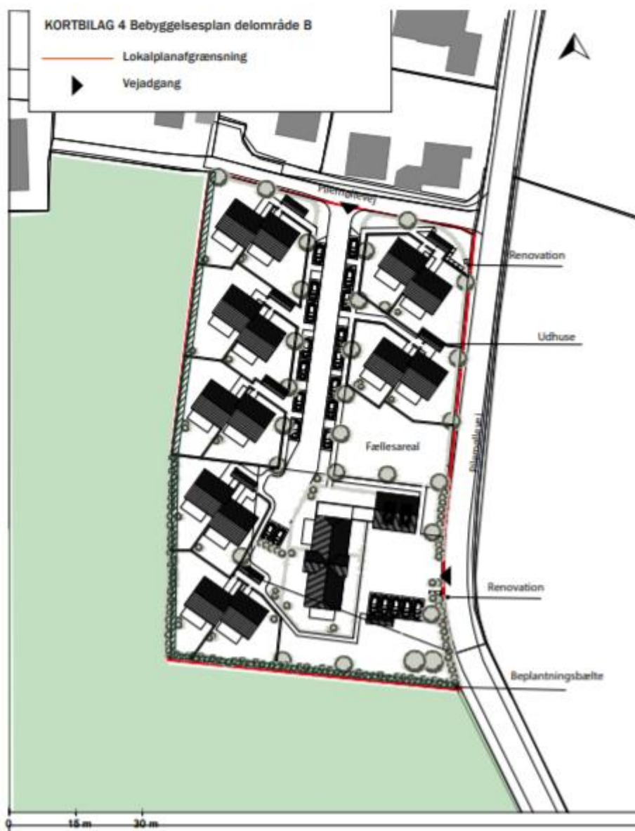
Kortbilag fra lokalplanforslaget