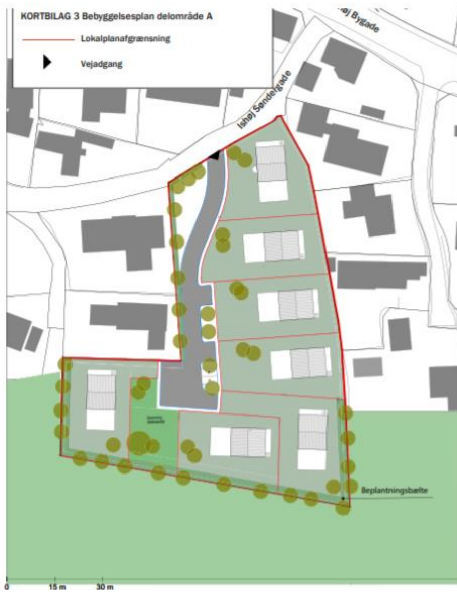
Kortbilag fra lokalplanforslaget