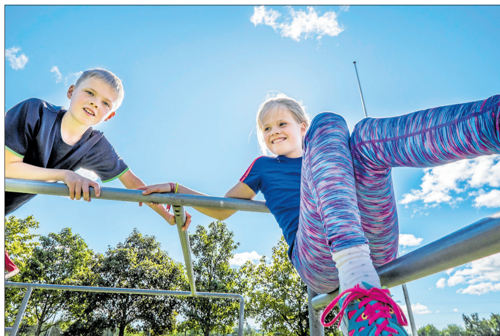
På Vallensbækvej kommer et område til parkour.

Efter tre års forberedelse kan anlæggesarbejdet begynde i det nye år, så Letbanen kan komme på skinner i 2024. Den 'moderne sporvogn' skal fragte passagerer mellem Ishøj og