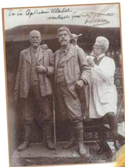
Laurits Tuxen arbejder på dobbeltstatuen af Michael Ancher og P.S. Krøyer, ca. 1907-08.