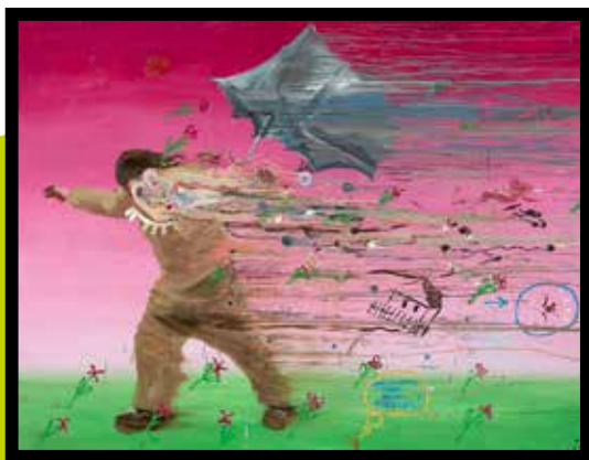
Andreas Golder. Gekackt non est pictum, 2006. ARKENS Samling.