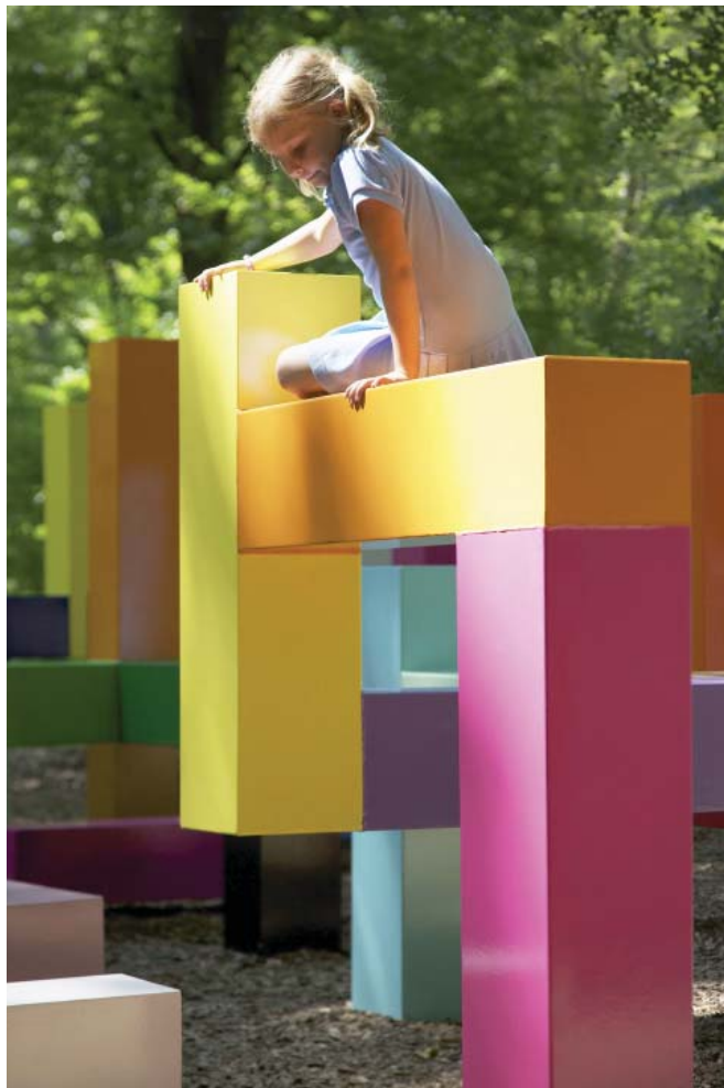
Jacob Dahlgren, Primary Structure , 2011 The Wanås Foundation. Foto: Wanås Konst

Fotos: Wanås i Skåne. Slot med skulpturpark åben for offentligheden. Kunsten inviterer til leg og bevægelse (se i øvrigt bilag med inspiration)