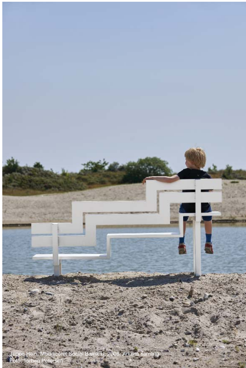
Jeppe Hein, Modifieret Social Bænk U, 2008. Arkens samling.