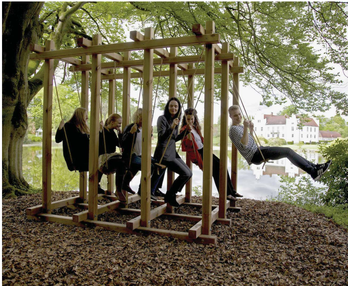
Molly Haslund, SWINGS – Coordination Model 2 , 2002/2014 The Wanås Foundation.