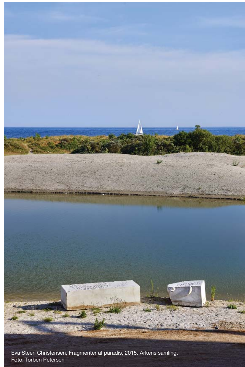
Eva Steen Christensen, Fragmenter af paradis, 2015. Arkens samling.