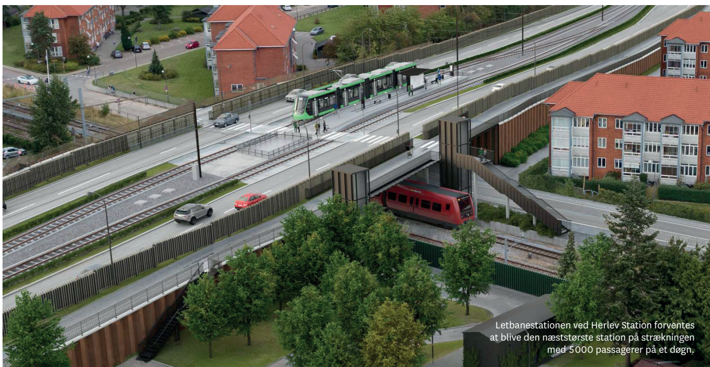
Letbanestationen ved Herlev Station forventes at blive den næststørste station på strækningen med 5000 passagerer på et døgn.