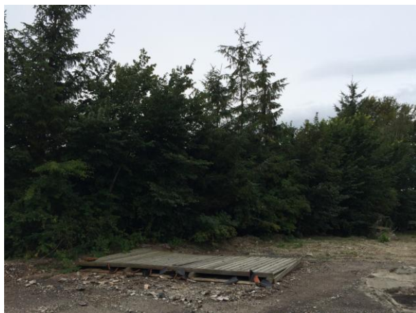
Billedet viser hvor tæt beplantningen var før rydning af fyrretræer.

Ishøj Kommune kan derfor ikke imødekomme en fældning af den pågældende røn. I kan dog godt beskære træerne, så grenene, der hænger lavt under kronen ikke tager alt udsigt og lys fra jer. De selvsåede hyld og lignende, der kommer under træerne, må gerne fjernes helt, da det er rønnene, der skal give afgrænsningen.