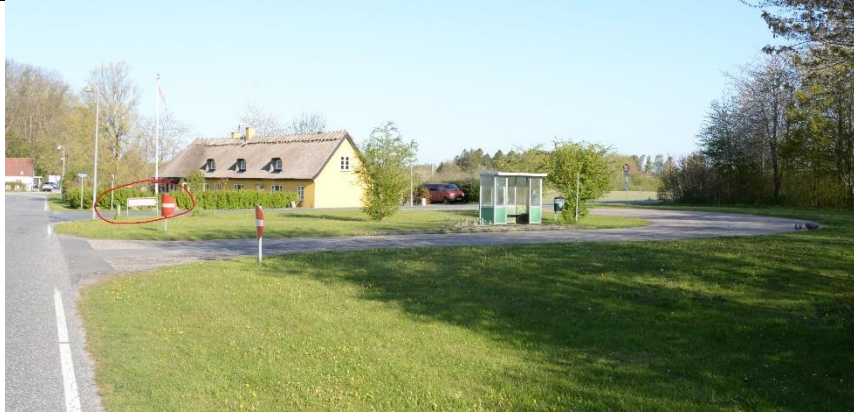
Området under højspændingsmasten. Set fra Torslundvej, fra syd mod nord.