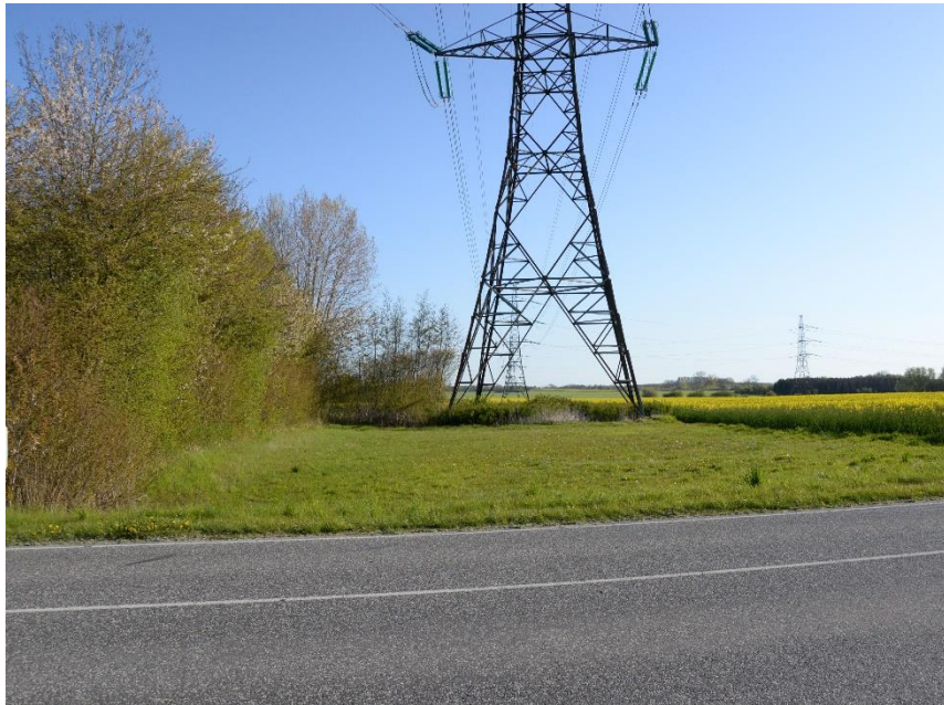
Jeg håber at I vil overveje at bruge området som en del af Ishøj Kommunes Biodiversitetsstrategi.