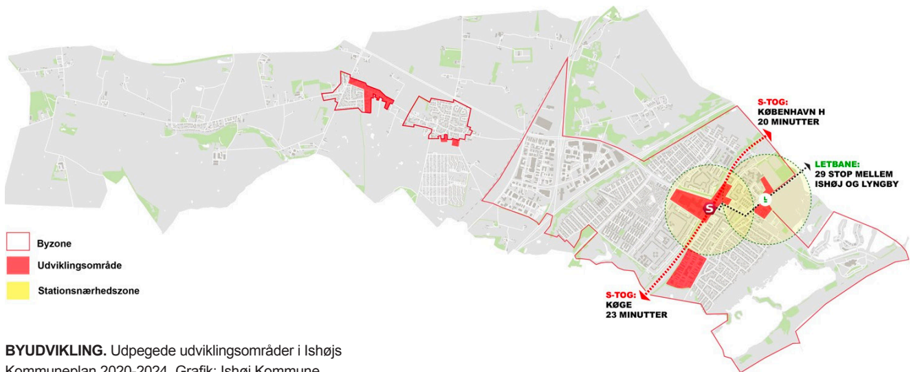
BYUDVIKLING. Udpegede udviklingsområder i Ishøjs Kommuneplan 2020-2024.