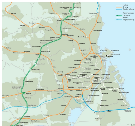
NY FORBINDELSE. Hovedstadens Letbane vil følge Ring 3 og forbinde Lyngby i nord og Ishøj i syd.

Kommuneplan 2020-2024 udpeger desuden potentielle byudviklingsområder på sammenlagt 93.200 kvadratmeter. Området omkring Letbanestation Ishøj Strand ARKEN er udpeget som et område for fremtidig byudvikling, hvor der bliver mulighed for at opføre boliger. Det er planen at udarbejde en helhedsplan for området.