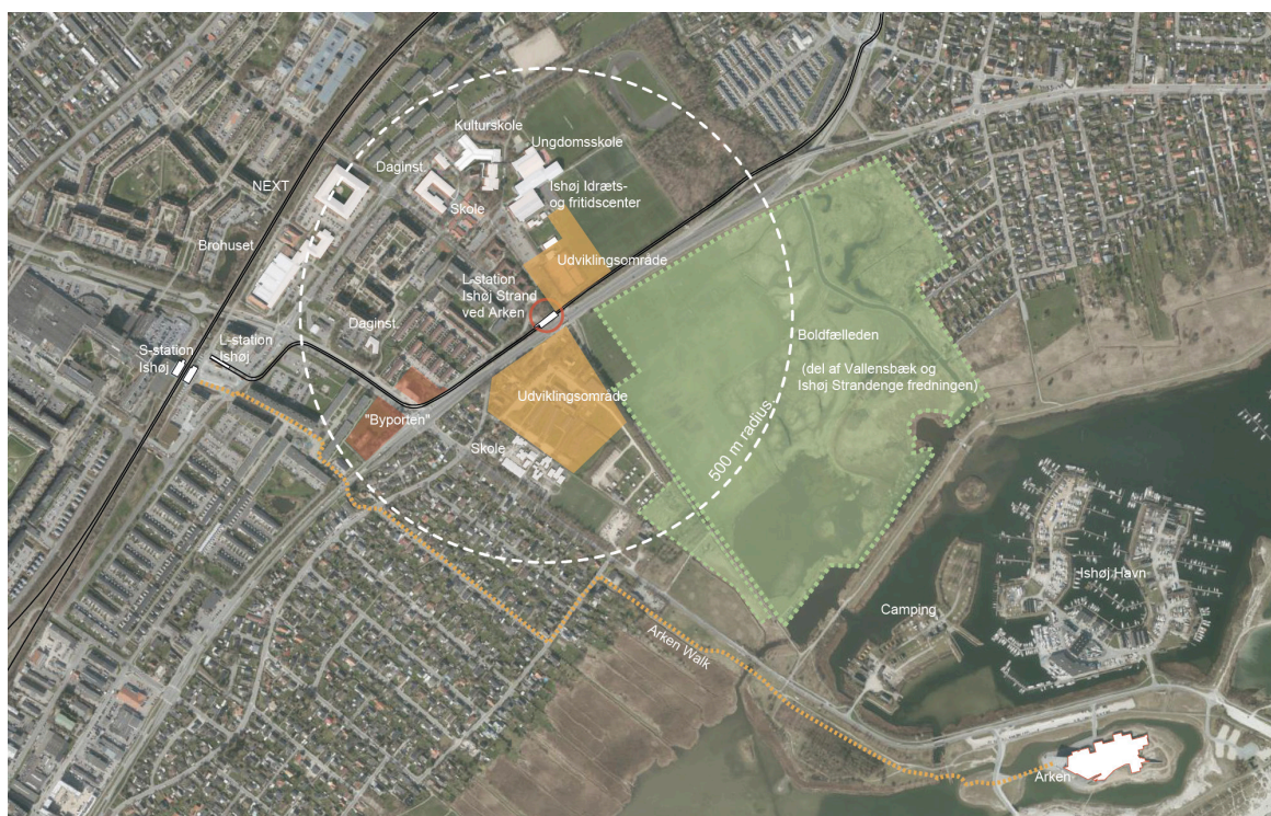
ET KNUDEPUNKT — I DAG OG I FREMTIDEN. Letbanestation Ishøj Strand ARKEN får en unik placering, på kanten af det åbne landskab og byen. Illustrationen viser bl.a. potentielle udviklingsområder, primære funktioner og en cirkel, der markerer det stationsnære område. Illustration: Ishøj Kommune

Letbanestation Ishøj Strand ARKEN er placeret langs Ishøj Strandvej i tilknytning til områder, der er udpeget som udviklingsområder. Allerede i dag er der en række institutioner, herunder Ishøj Idræts- og Fritidscenter, Ishøj Kulturskole, Ishøj Ungdomsskole, Vejlebroskolen og Trækronernes Vuggestue tæt på letbanestationen. Med Letbanestation Ishøj Strand ARKEN vil der opstå et nyt trafikalt knudepunkt i byen og det må forventes, at hverdagens liv og aktiviteter i denne del af byen vil øges i takt med, at der bliver byudviklet.