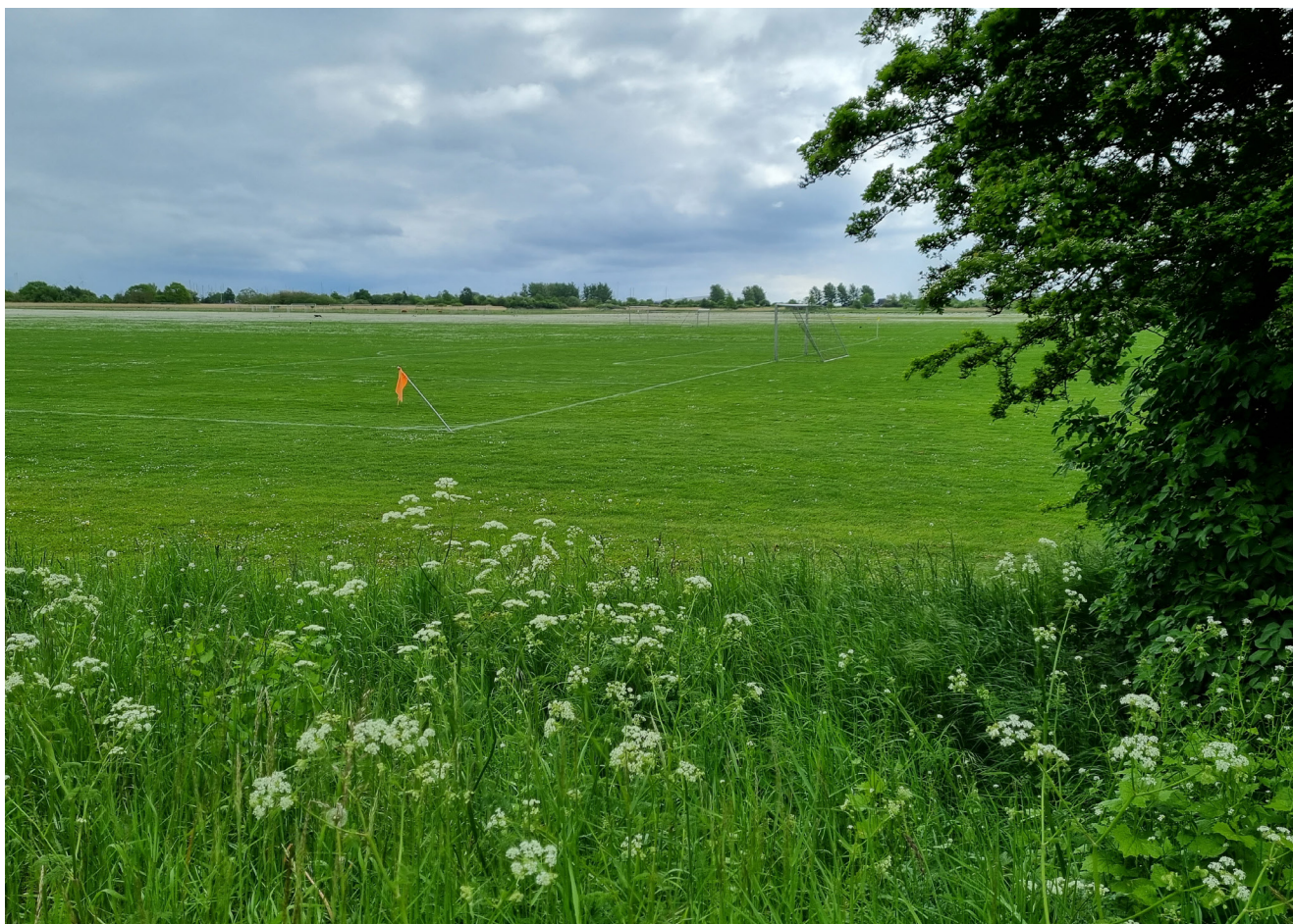
UDSIGT. Udsigt over det fredede areal (Boldfælleden) diagonalt overfor Letbanestationen.

DESTINATION OG WAYFINDING. Letbanestation Ishøj strand ARKEN bliver en ny ankomst til Ishøj og ARKEN, hvorfra mange vil benytte Strandparkstien til museet. Et kunstprojekt på letbanestationen kan eventuelt samtænkes med wayfinding.