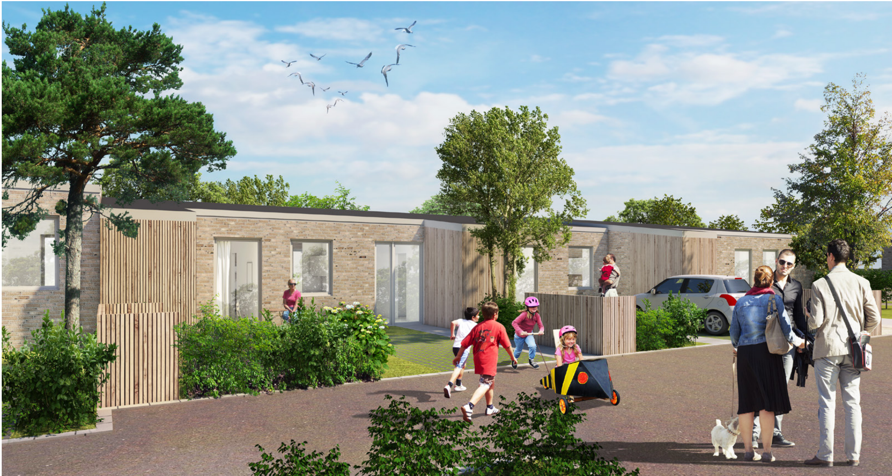
ILLUSTRATION FRA PARKERINGSAREAL