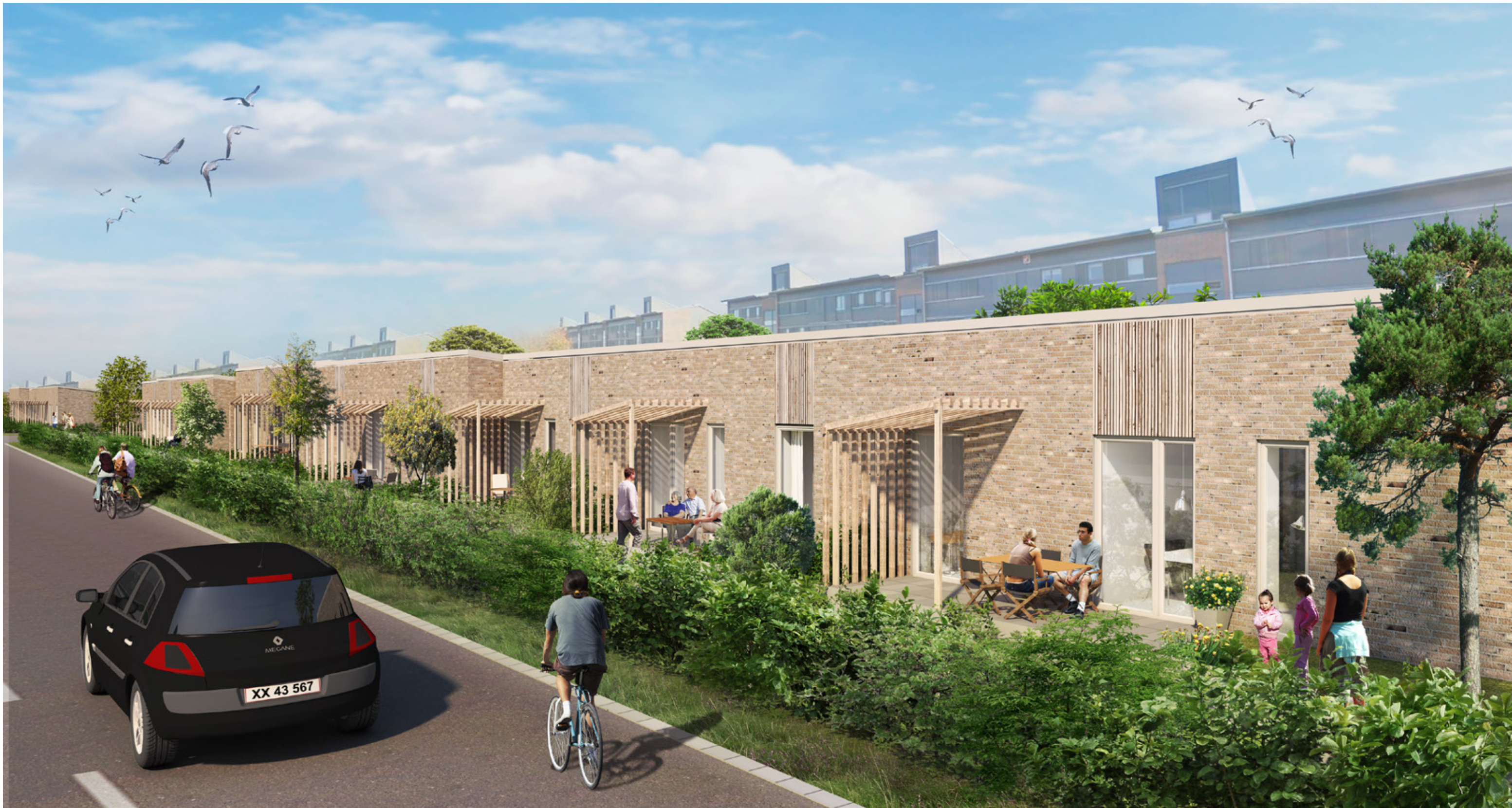
ILLSTRATION FRA ISHØJ BOULEVARD