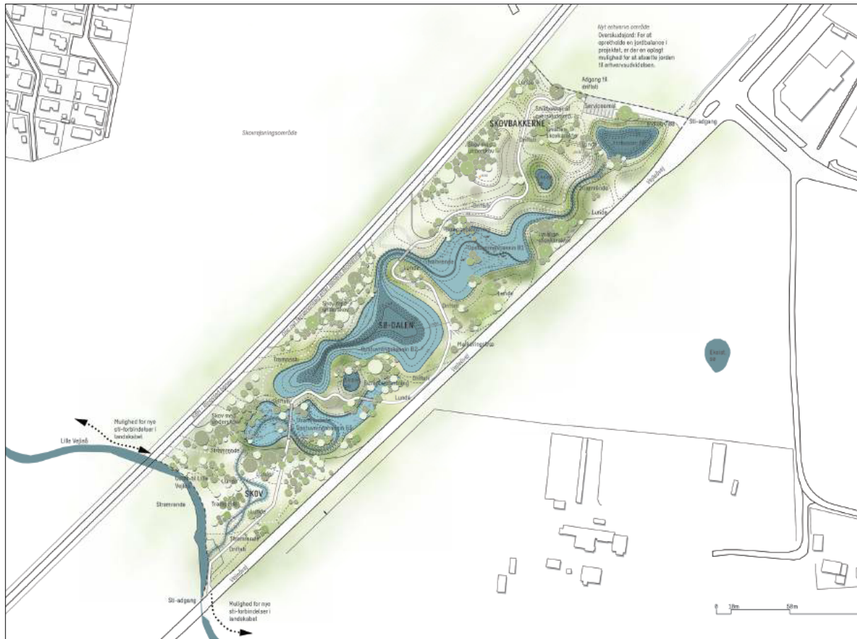
Figur 2: Principskitse for klimatilpasningsprojekt med rekreativ anvendelse for Pilemølle erhvervsområde Syd med udledning til Li. Vejle Å.