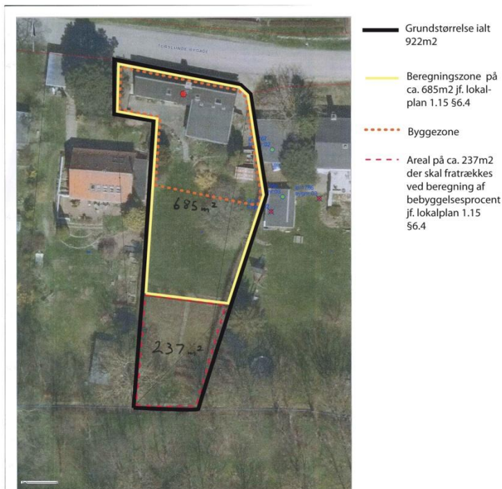
Beregning af bebyggelsesprocent Torslunde Bygade 17 jf. Lokalplan 1.15

I henhold til lokalplanen beregnes bebyggelsesprocenten ud fra et reduceret areal, da 1/3 af arealet nærmest Lille Vejle Å skal fratrækkes. Dog kan hele grunden medregnes, hvis byggegrænsen mod åen overskrides og bebyggelsesprocenten for det nye hus ville dermed blive 30. I dette tilfælde overskrides byggegrænsen dog ikke. Se fig. 2