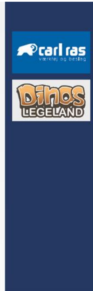
Pylon H: 6000 x B: 1900 mm