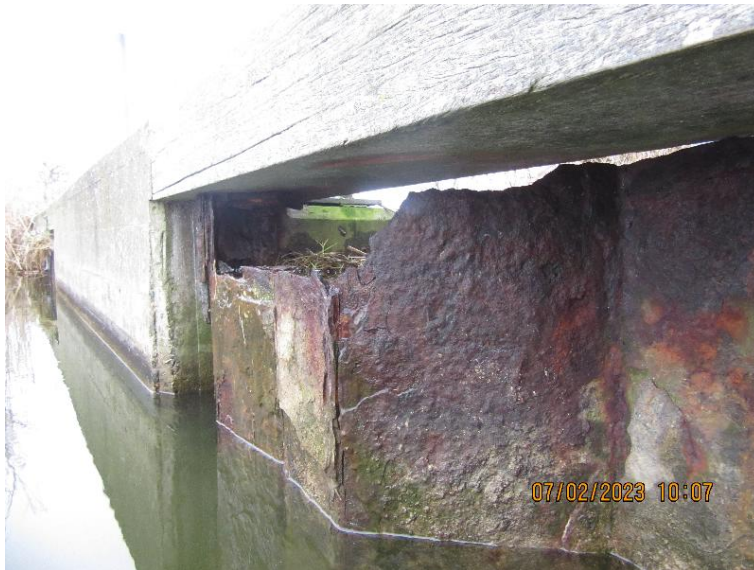
Figur 10 Spuns ved Lille Vejle Sø

Spunsen er generelt meget korroderet, og vi har vurderet at den eneste realistiske udbedring er at udskifte spunsen.