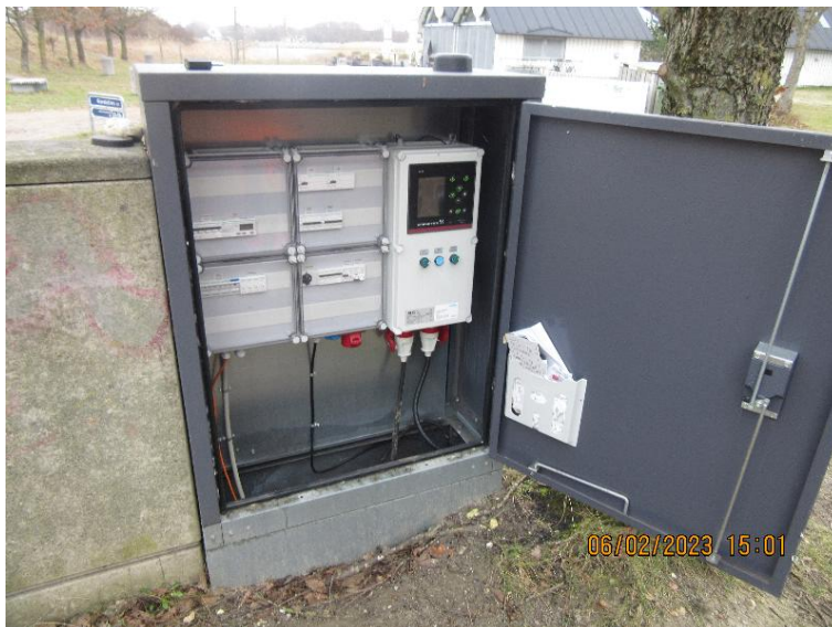
Figur 8 Ny styring i nyt elskab

I scenarie 3 har vi forudsat at de pumper mv. der ikke er udskiftet i nyere tid, bliver udskiftet inden for en kort årrække.