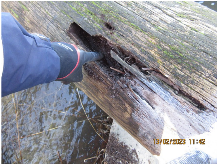
Figur 5 Grønnebro, dyb rådskade i nedre tværdrager