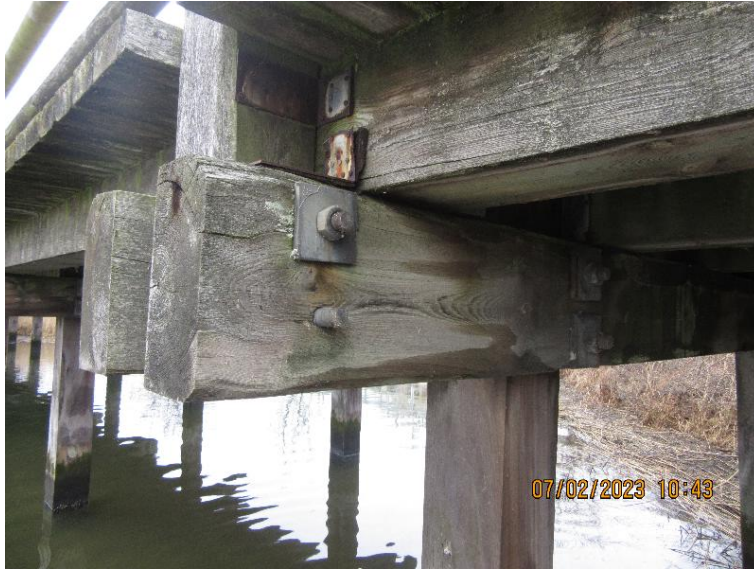
Figur 2 Fiskebroen, en af de lave broer. Rustne beslag og manglende møtrik. Nogle pæle lider af begrænsede rådangreb omkring vandlinjen.

Vi har generelt forudsat følgende udbedring: