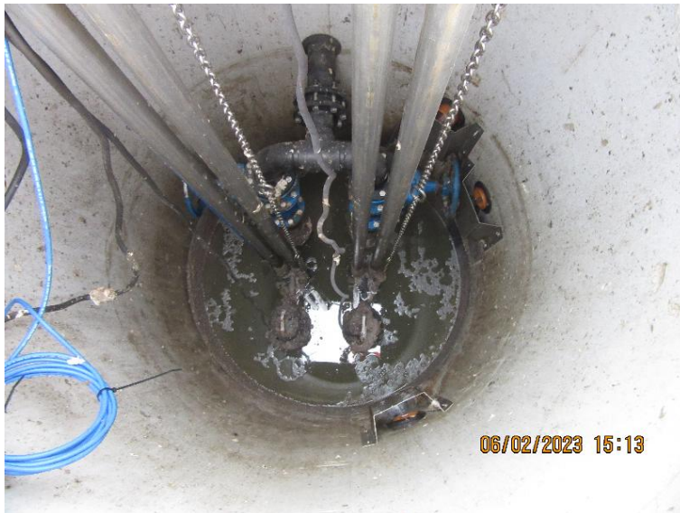
Figur 7 Foto ned i brønd. Selve pumpen er neddykket