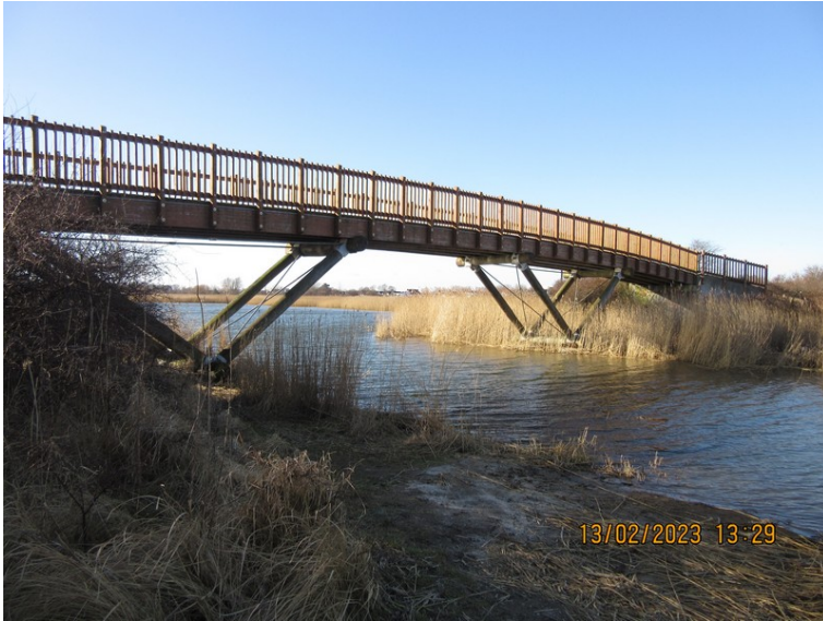
Figur 3 Jægerbro. De fem høje broer har alle samme generelle design