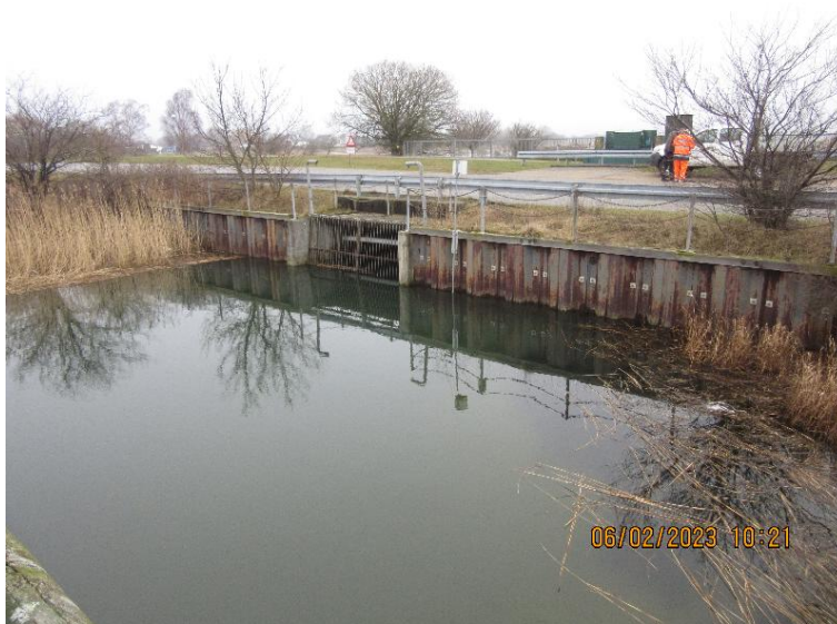
Figur 9 Hundige sluse

Sluserne er generelt betonbygværker, der desuden har funktion som bro for veje og stier. Vandstanden kontrolleres ved lodrette sluseporte, der kan åbne og lukke ved hjælp af hydraulik og automatisk styringselektronik.