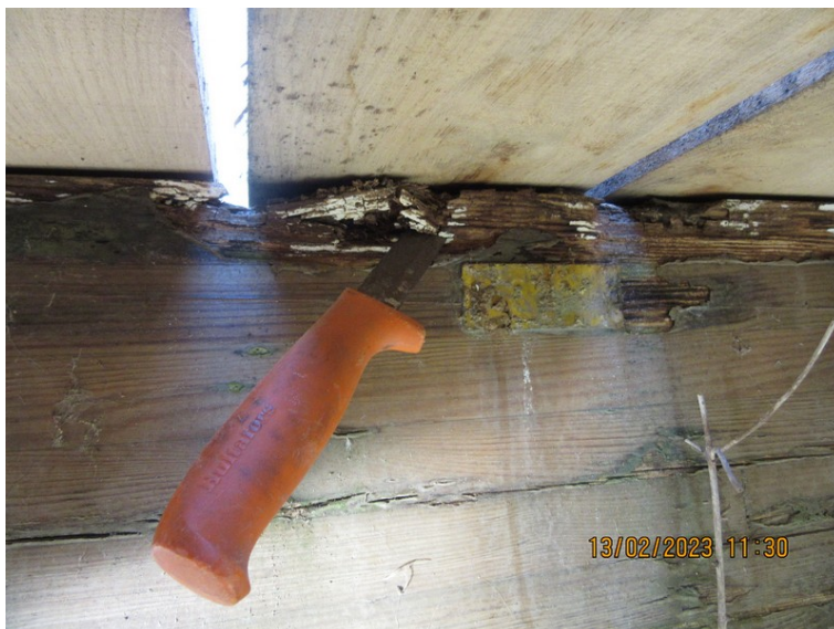
Figur 6 Grønnebro. Rådskade i oversiden af bærende limtræsbjælke lige under dækplankerne