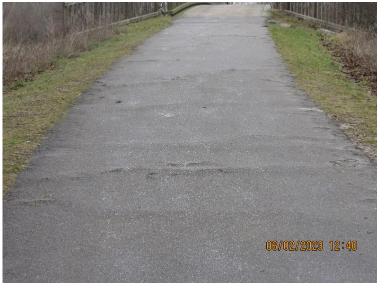
Figur 1 Typisk skadebillede hvor rødder har ødelagt stibelægningen

Scenarie 3: Total udskiftning af stibelægning inkl. bærelag på de udsatte steder, og etablering af rodbarriere.