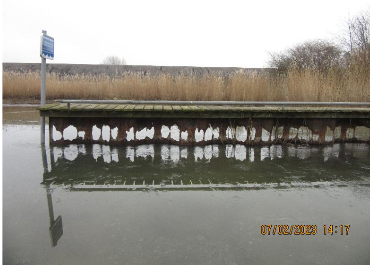
Figur 11 Spuns (gennemtæret) og bro ved Brøndby Havn

Ved Brøndby havn er der et stykke spuns der ikke er en del af vandspejlsreguleringen, men som bærer en bade-/bådebro. Denne spuns er totalt gennemtæret foroven og er ikke en sikker underbygning for broen. Derfor skal enten broen nedlægges eller spunsen udskiftes.