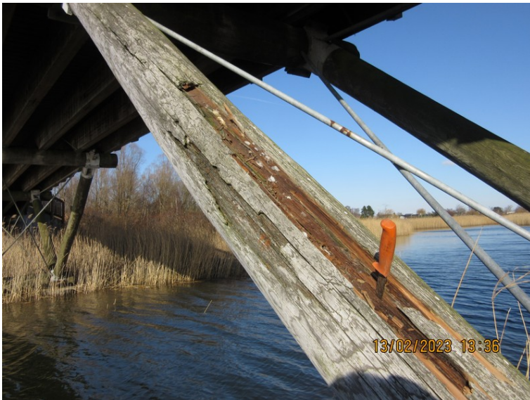
Figur 4 Jægerbro. Svær rådskaade i et af de bærende skråben