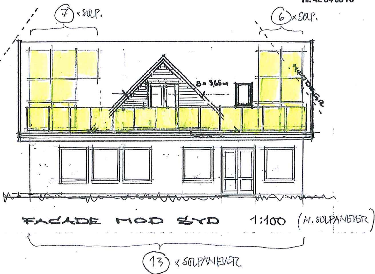
FACADE MOD SYD 1:100 (M. SOLPANELET)

Herstedvesterstræde 33 2620 Albertslund Tlf. 42 64 08 70