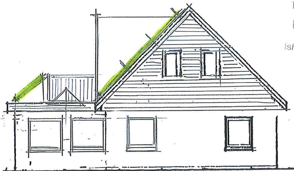
FACADE MOD ØST 1:100 (M. SOLP.)