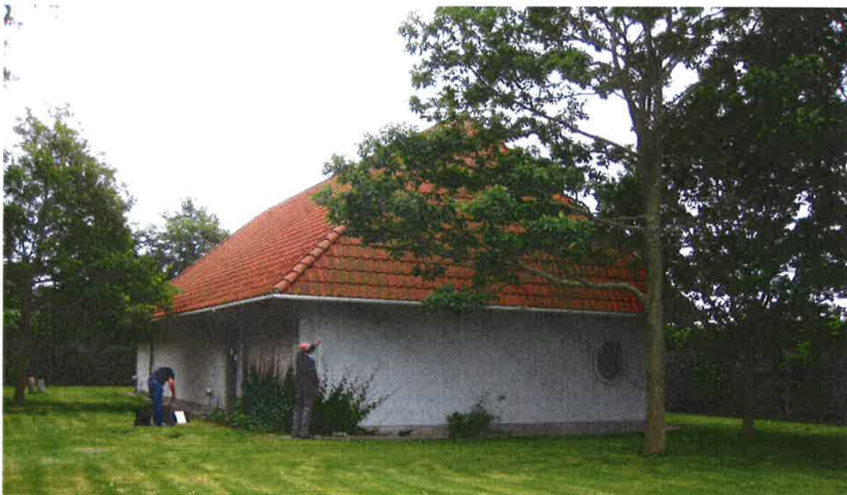
Det eksisterende bygværk