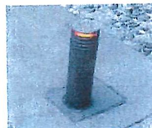
Pullert med lys