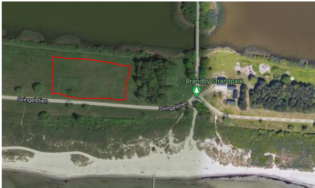
Figure 1: Beliggenhed 1: Brøndby Strand