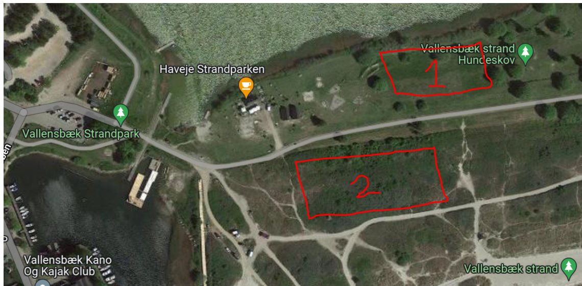
Figure 2: Beliggenhed 2: Vallensbæk Strand