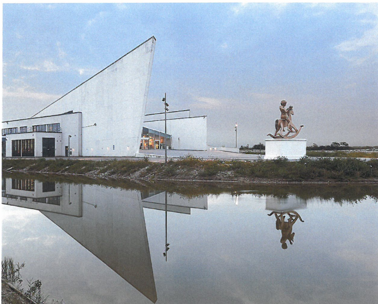
ARKEN Museum for Moderne Kunst

Museumsinspektør: Gry Hedin gry.hedin@arken.dk Tlf: +45 5167 0215