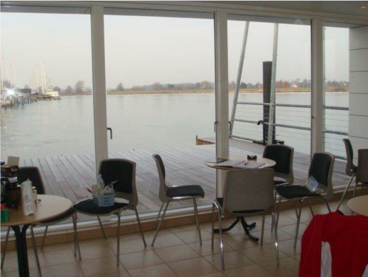
Køkken og terrasse