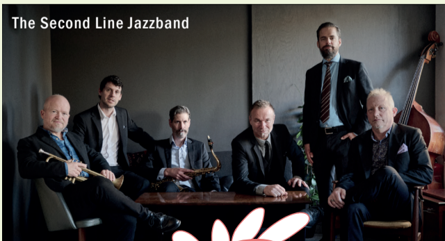
The Second Line Jazzband