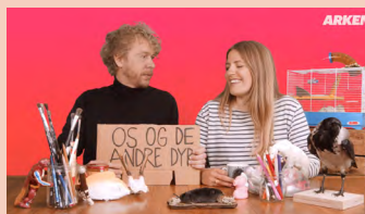
OS & DE ANDRE DYR. Still fra film.

Oplev en lang række spændende kunstnere, samlingsværker og tidligere udstillinger på ARKENs YouTube-kanal. Her kan du lære mere om skulpturparken, opleve kunstnere som Olafur Eliasson, Randi & Katrine, Martin Bigum m.fl. og meget mere.