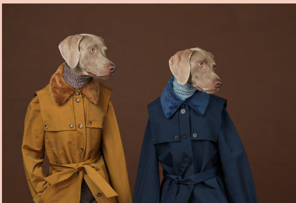
William Wegman, Looking Right , 2015.