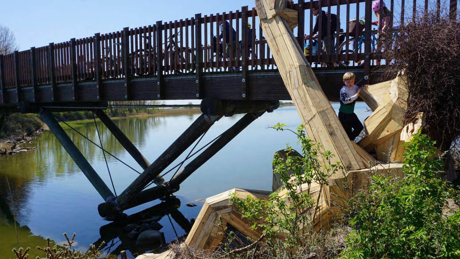
Kæmpen Oscar, foto Thomas Dambo