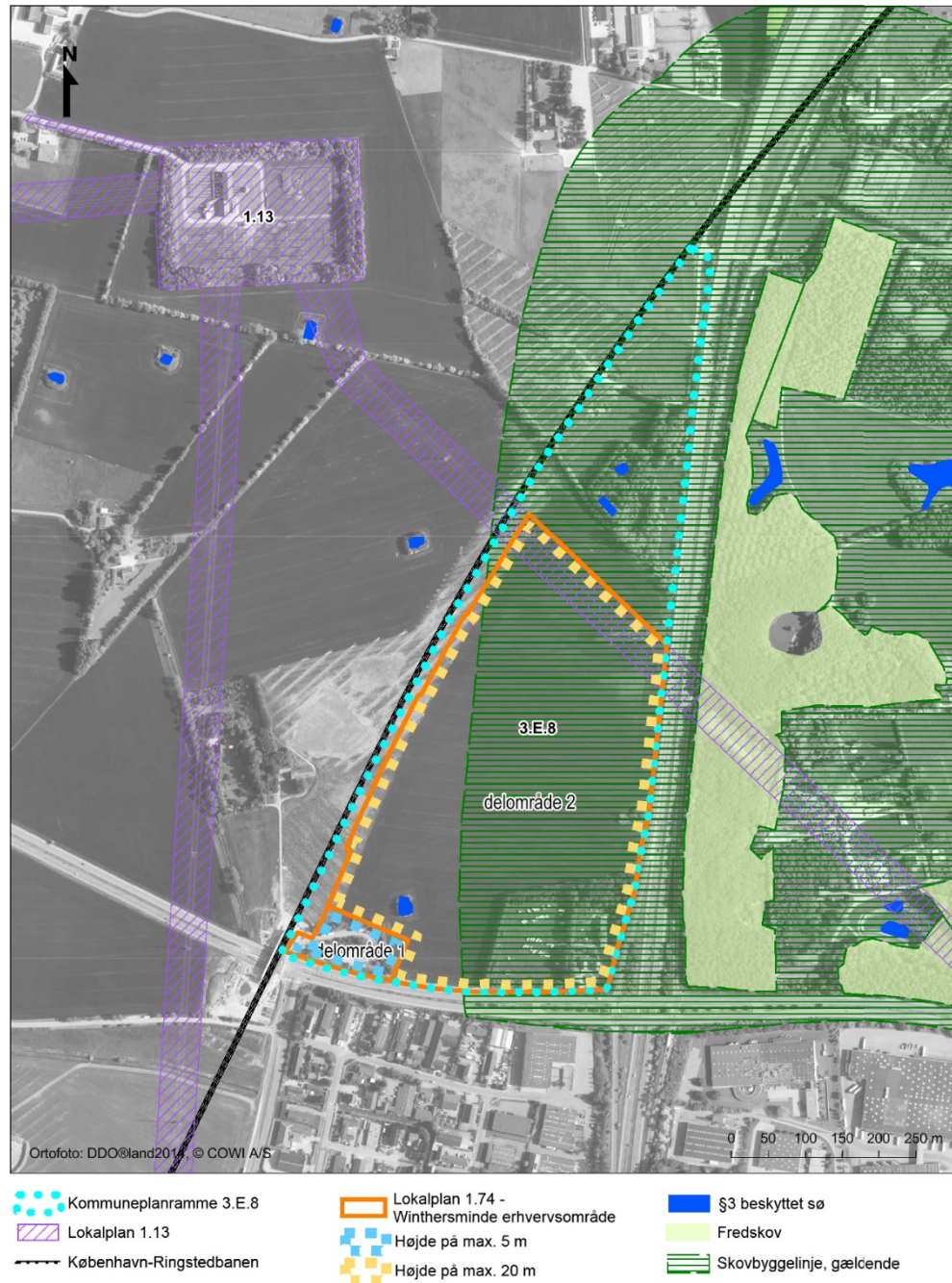
Figur 4-1 Miljø- og planforhold ved lokalplanområdet