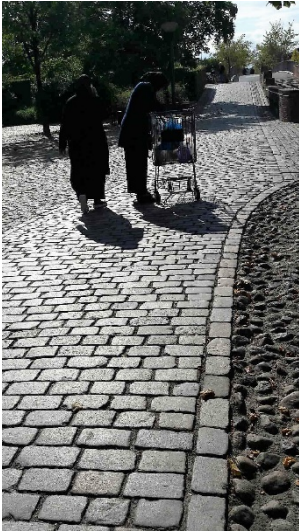
Belægning ved indgang fra Østergården

Giver store problemer for dårligt gående, rollator og kørestolsbrugere.