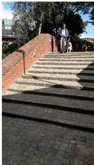
Trappe ved byhave