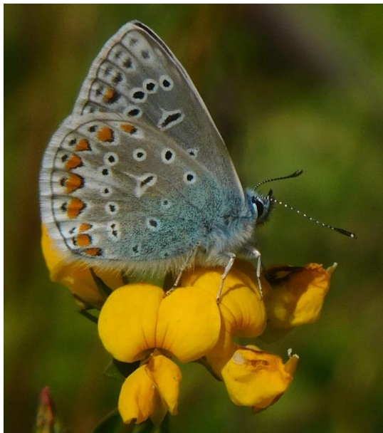
Almindelig blåfugl på kællingetand