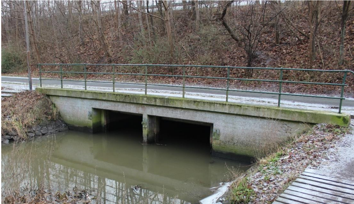
Ny letbanebro etableres foran eksisterende bygværk med overlap af dette

Det nye brodæk vil delvist blive placeret over dækket i den eksisterende tunnel, hvor der i dag er en asfalteret sti. Nedenstående billede viser det eksisterende indløb til betonunderføringen under den eksisterende sti, hvor den nye bro opføres.