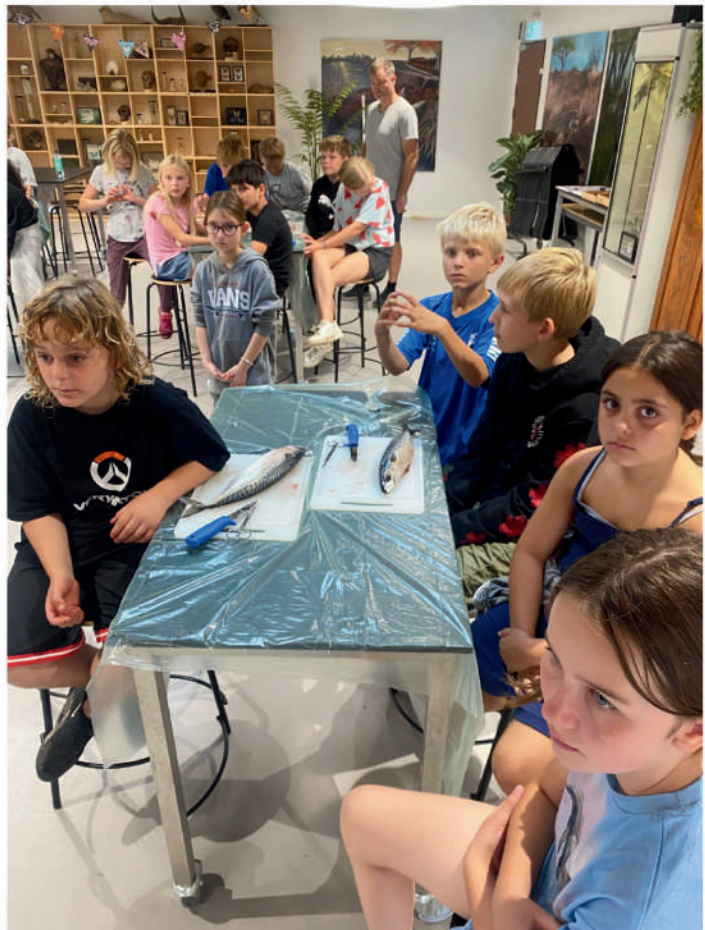
4-klasse på lejrskole på Naturama.