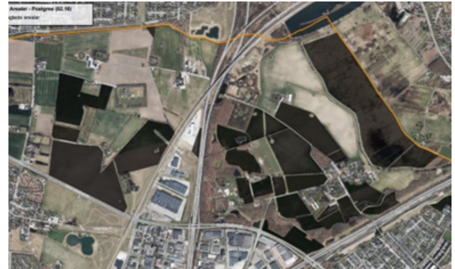
Oversigtskort over grønne kommunale arealer, hvor en del er bortforpagtet.

ØKONOMI: Puljen til mere natur, træer og oaser. Fortabt indtjening ved udtagning af forpagtede arealer.