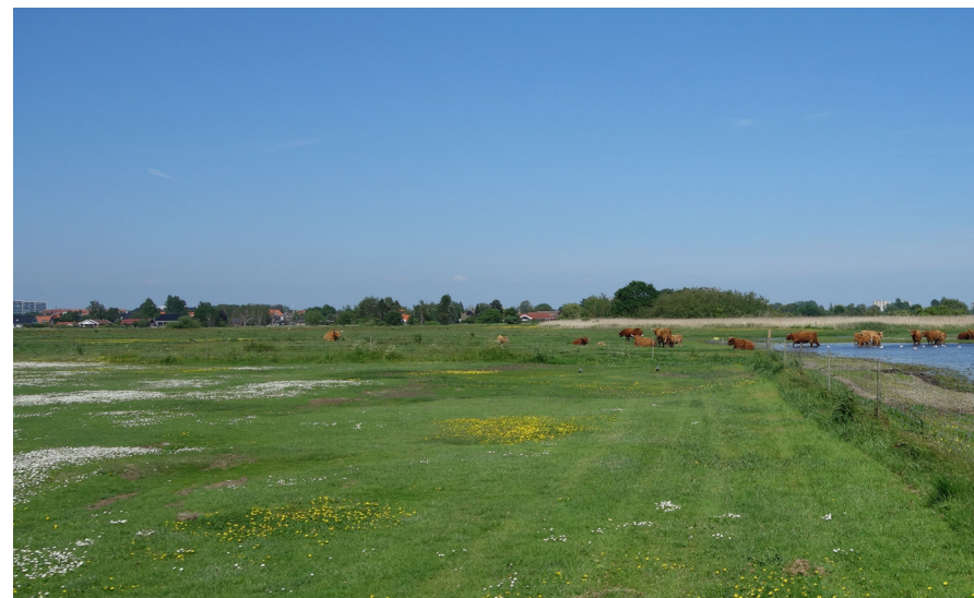
Foldhegningen (th. på foto) flyttes så de sydlige boldbaner i fremtiden indgår i naturområdet.