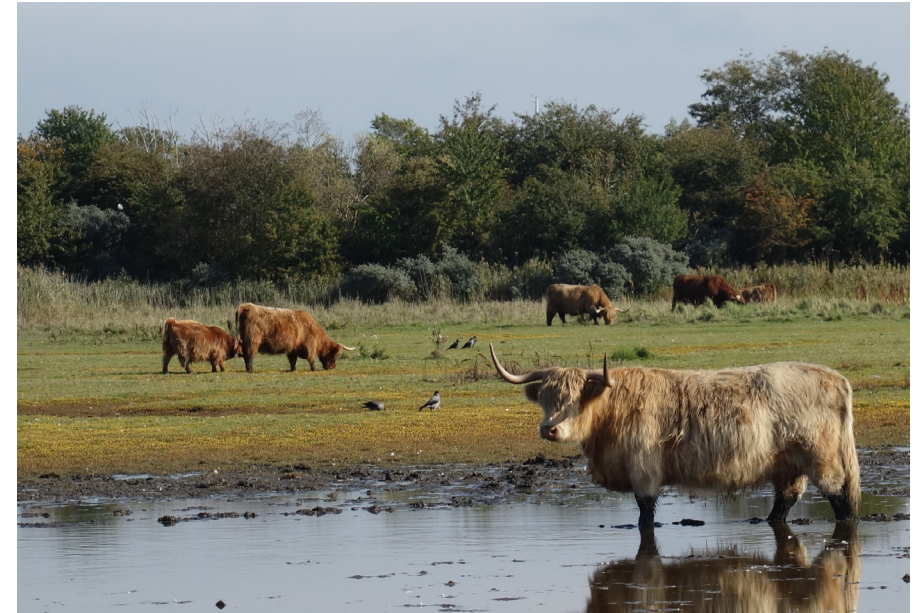
Skots højlandskvæg græsser ved vandhul