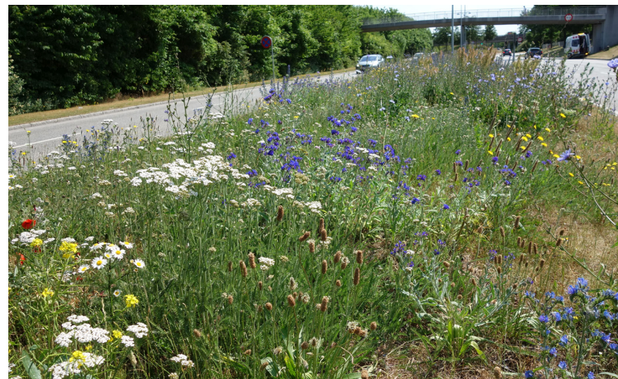
Udsået hjemmehørende blomsterblanding på midterrabat på Stationsvej.