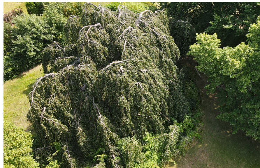
Den gamle hængebøg ved Ishøj Gård er et unikt syn i kommunen.

ØKONOMI: Puljen til mere natur, træer og oaser. Egne driftsmidler.