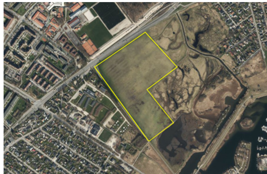
Boldbanerne fylder meget det åbne landskab. Gul angiver boldbanernes udbredelse.

ØKONOMI: Projektet finansieres af Puljen til mere natur, træer og oaser.