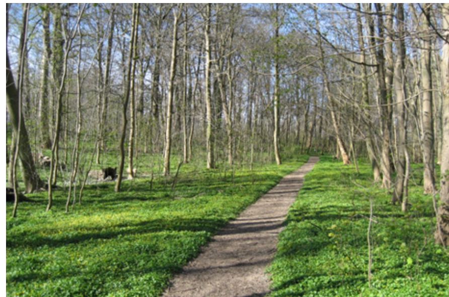
Naturstien går gennem skoven ved Benzonsdal langs Lille Vejleå.