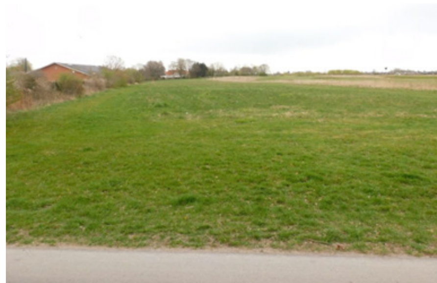
Slået kommunalt græsareal ved Ishøj Gaard. Mindre græsarealer som disse tænkes ind i en slåningsplan.

ØKONOMI: Græsslåninger og såning betales over driften.