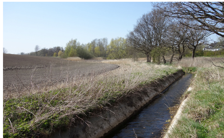
Lille Vejleå er på flere strækninger udrettet og flisebelagt, hvilket giver ringe levevilkår for plante- og dyreliv.

SAMARBEJDSPARTNERE: Greve, Høje Taastrup og Ishøj Kommuner samt de tre forsyningsselskaber.