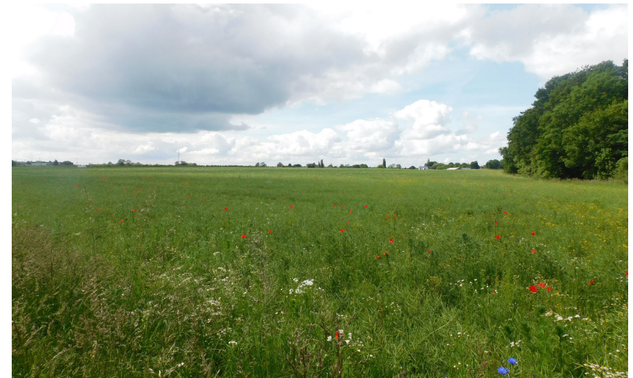
Grønt er flot i landskabet, men landbrugsarealer er ørkener biologisk set og huser ikke mange arter af vilde planter og dyr.